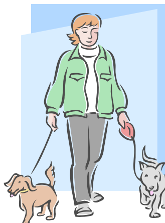
2. dog walker