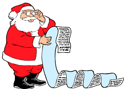
1. Santa Claus