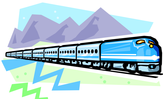
1. travelling by train