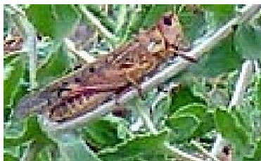
Locusts are nearly invisible amid damaged foliage

Adapted from http://www.un.org/apps/news/ , 5 July 2007