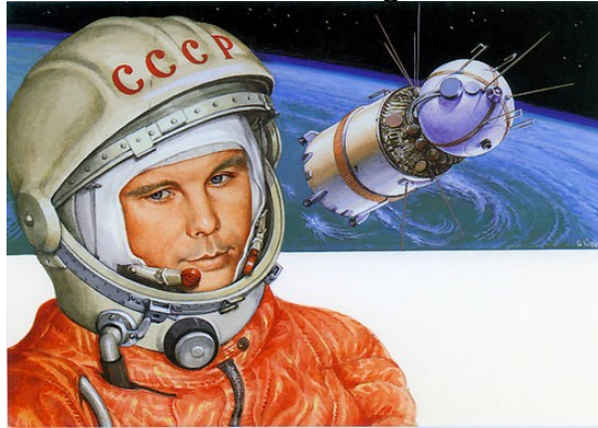
Slika 7 – J. Gargarin