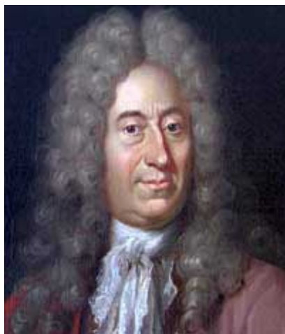
slika 3 – O. Römer