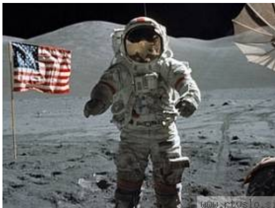
slika 8 – N. armstrong