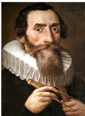
Slika 2 – J. Kepler