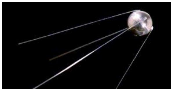
slika 6 - Sputnik

(vir: http://vesolje.net/navtika/rus/sputnik/sputnik1/index.htm )