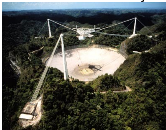
Slika 9 – Arecibo observatorij