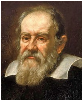
slika 1 - G. Galilei