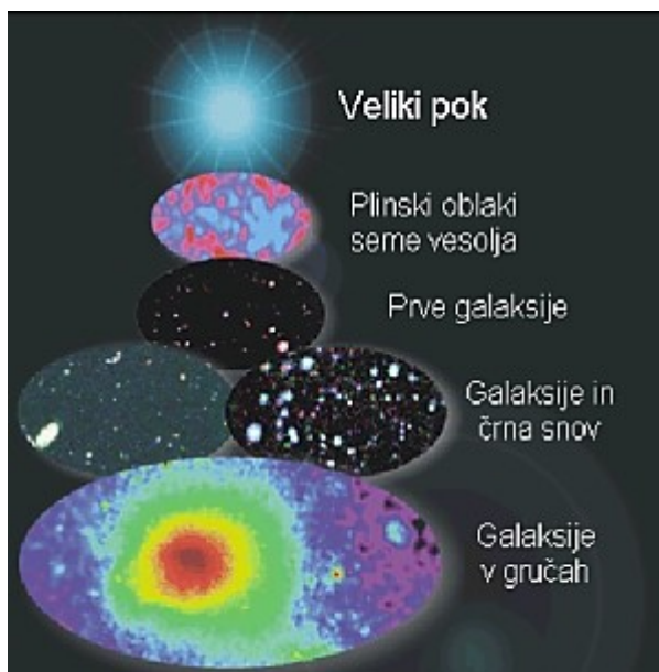
1. slika: shematski prikaz razvoja vesolja

10.000 let po Velikem poku je temperatura padla na tako raven, da so se pričeli oblikovati masivni delci. Z njihovo rastjo premera, se je povečevala tudi njihova gravitacijska privlačnost. Majhne nepravilnosti v sami strukturi osnovnih delcev so povzročile njihovo rast. Lastnosti delcev, ki jim omogočajo lepljenje materije nase, so deset milijard let kasneje povzročile oblikovanje sedaj znane gobaste strukture vesolja.