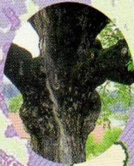
oreh v Kočevski Reki (obseg debla 124 cm)