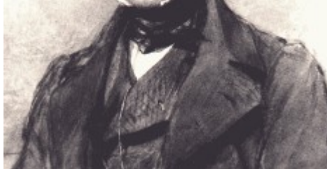
(slika 1: Charles Darwin)