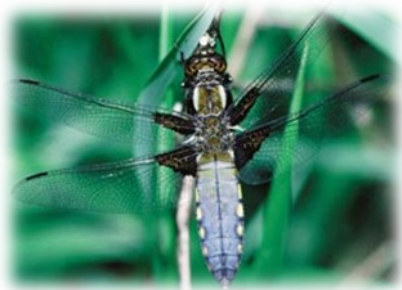
Slika 2 raznokrili kačji pastir

Ker so mesojedci si morajo hrano uloviti. Kačji pastirji imajo zato noge oblikovane v košaro. Vanjo ujamejo komarje, muhe... med letom in jih med letom tudi pojejo. Če seveda plen ni prevelik zalogaj. Takrat si privoščijo kratek postanek. Pri hranjenju jim pomaga obustni aparat, ki hrano raztrga ali zdrobi. Njihovi izločki so suhi, saj varčujejo z vodo. Tudi ličinke so plenilske, hrano pa ujamejo s pomočjo preoblikovanih okončin, ki se imenuje labium*. Ime je dobila po tem, da je skrita pod glavo in oprsjem. Ob pravem času jo bliskovito iztegnejo proti plenu in ga prežvečijo z močnimi čeljustmi.