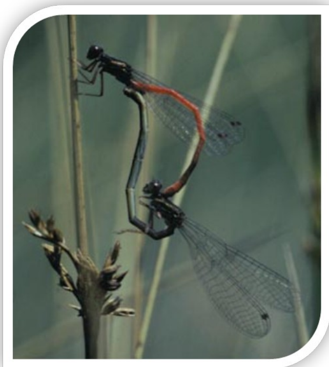
Slika 4 Kopula ali koleselj

Po preobrazbi dokler spolno ne dozori, se kačji pastirji ne zadržujejo ob vodah ampak jih najdemo na jasi ali travniku. Ko pa spolno dozori, pa začnejo iskati samice. Nekateri ustvarijo pravcate teritorije, ki jih v neumornem letu vneto branijo pred konkurenti, spet drugi ob iskanju samičk na videz brezciljno obletavajo goste šope obvodnega rastlinja, tretji pa iz visoke preže oprezajo za samico. Večji del življenja samičk pa prav nasprotno ne poteka neposredno ob vodi, zato naletimo nanje neprimerno redkeje. Semkaj prihajajo le na parjenje in odlaganje jajc, drugače pa jim je ljubše zadrževanje ob grmovju, gozdnem robu ali jasi, kjer se skrite pred spolnim nadlegovanjem vneto prehranjujejo in nabirajo maščobne rezerve za produkcijo številnih jajčec. Parijo pa se tako, da kadar se v bližini samčka pojavi samička, samec samičko najprej pograbi z nogami za oprsje, nato zvije zadek in jo z zadkovimi priveski, ki so vrstno specifično oblikovani, nič kaj nežno pograbi za predprsje ali glavo. Pri parjenju kačjih pastirjev spolni organi, ki so pri samčku in samički na koncu zadka, sploh ne pridejo v direktni stik. Samček ima namreč na drugem členu zadka kopolacijski aparat, ki je zelo pomemben za parjenje. Tja si pred združitvijo prenese semensko tekočino, nato samička, ki jo samček še vedno drži z zadkovimi priveski, spodvije svoj zadek ter spolno odprtino do sekundarnega kopolacijskega aparata samčka in partnerja se združita. Nastali srčasti lik imenujemo kopula ali koleselj.