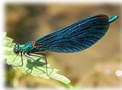
Slika 3 enakokrili kačji pastir