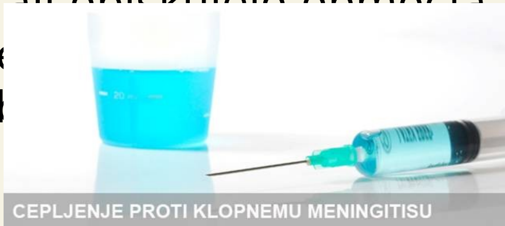
CEPLJENJE PROTI KLOPNEMU MENINGITISU