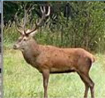
Rdeči jelen ( Cervus elaphus )