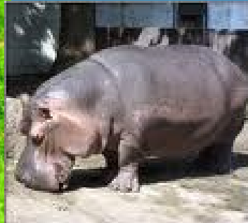
Pivodni konj ( Hippopotamus amphibius )