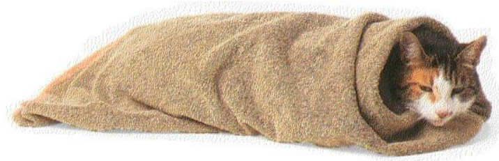
Slika 6: Bolna mačka II

Je virusna bolezen, ki slabi obrambne mehanizme mačk. Prenaša se predvsem med mačkami, ki živijo skupaj, lahko pa se od matere okužijo še nerojeni mladiči ali pa stari nekaj dni s pitjem mleka. Od okužbe do bolezenskih znakov lahko minejo tudi tri leta. Bolna žival je apatična, nima pravega teka, pogosto je slabokrvna. Zaradi oslabele telesne obrambe je zelo občutljiva za številne druge bolezni. Pogosto zboli za rakom. Bolezen ni ozdravljiva.