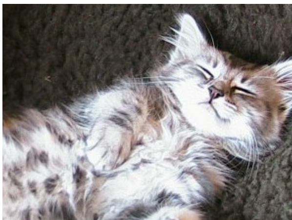
Slika 7: Zadovoljna mačka

Predenje je znak prijateljskega družabnega razpoloženja in ga lahko na primer izkaže veterinarju ranjena mačka in s tem nakaže potrebo po prijateljstvu, ali daje znak lastniku, ko se zahvaljuje za izkazano prijateljstvo.