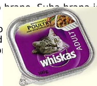
Slika 3: Mačja hrana

V trgovinah lahko za mačke kupimo suho in mokro hrano. Suha hrana je navadno v obliki briketov in služi mački kot sestavni del prehrane. Mokro hrano lahko izmenjujemo s suho. Navadno je v obliki konzerv ali pa v obliki konzerviranih vrečk. Kot dodatek mački ponudimo tudi posebne bonbone, ki so posebej pripravljena poslastica za mačko.