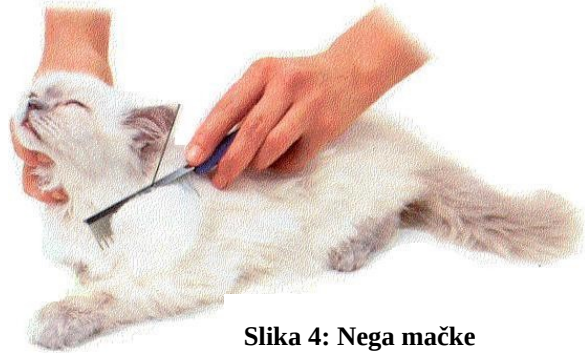
Slika 4: Nega mačke