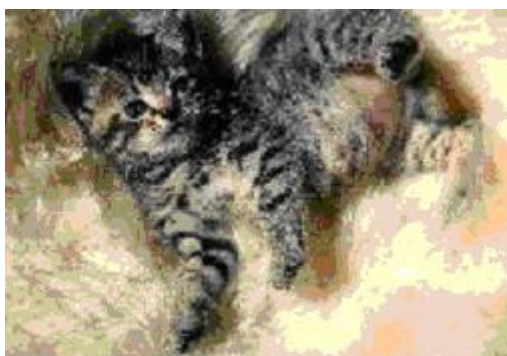
Slika 1: Mačka

Mački uspe ostati udomačena žival zaradi posledic njene vzgoje. Ker živi z drugimi mačkami (svojo materjo in vrstniki iz legla) in ljudmi (družino, ki jo je »posvojila«) vse svoje rano in kasnejše otroštvo, se naveže na oboje in zdi se ji, da pripada obema vrstama. Ko pa popolnoma odraste, je večina njenih odzivov mačjih in do svojih človeških lastnikov zadrži le en pomemben odziv. Z njimi ravna kot z nepravimi starši. Do tega pride, ker so prevzeli dolžnost njene prave matere v občutljivi dobi rane mladosti in so ji dajali mleko, jo redno hranili in ji nudili udobje, ko je odraščala.