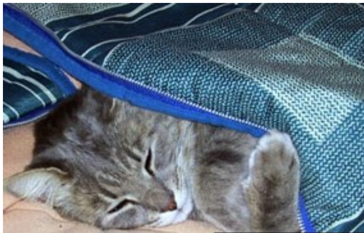
Slika 9: Speča mačka