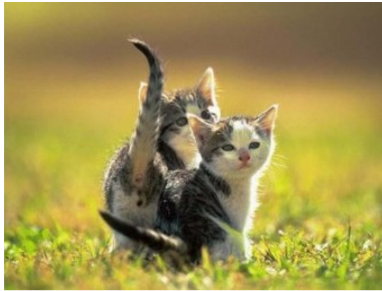
Slika 2: Mladi mački