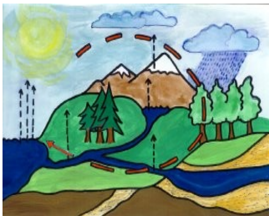
slika 1 – kroženje vode v naravi