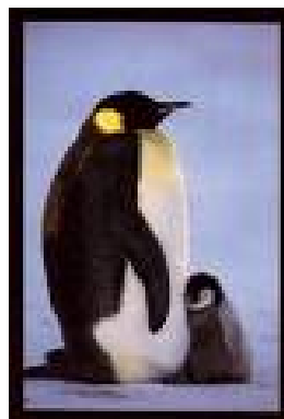
Slika 11: Mladič kraljevskega pingvina