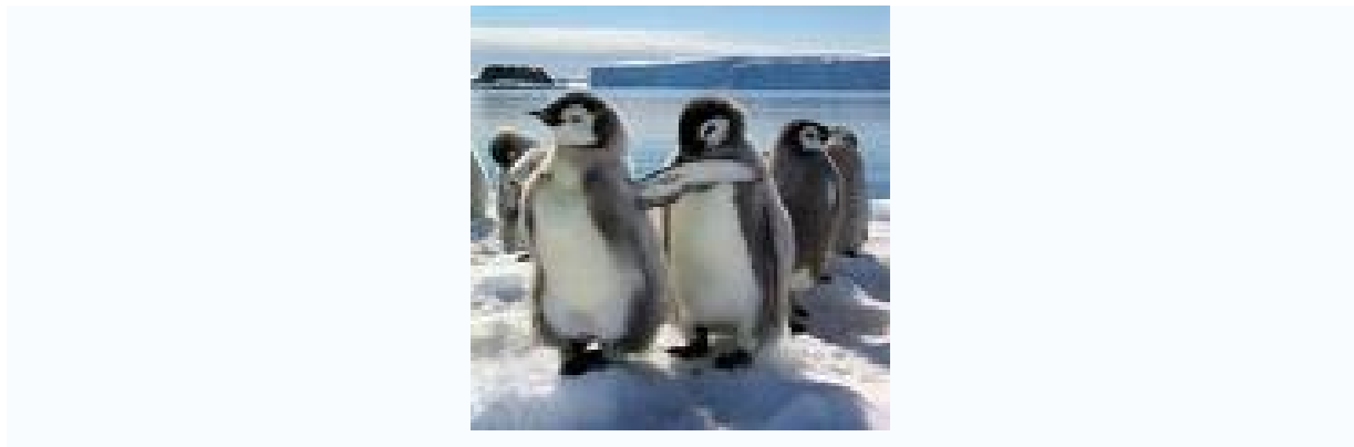
Slika 2: Pokriti so z gostim perjem

Pokriti so z gostim perjem. Pred mrazom jih ščiti debela plast podkožne maščobe. V vodi pa jih pred izgubo toplote dodatno ščiti še debela plast nepremočljivih naoljenih peres.