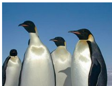
Slika 9: Cesarski pingvini

Čeprav je cesarski pingvin morski ptič in svojo hrano pridobiva iz morja, se njegova gnezda nahajajo za zaščitene ledene grebene globoko v notranjosti, pogosto tudi nekaj deset kilometrov od morja. Ker je obdobje gnezdenja zimski čas, si morajo pingvini izbirati takšna mesta, na katerih se led ne začne taliti preden postanejo mladički samostojni. Zato morajo nekateri včasih prepotovati tudi do 100 km daleč od obale.