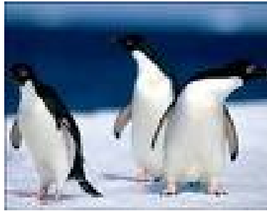
Slika 7: Adelijski pingvini v skupini