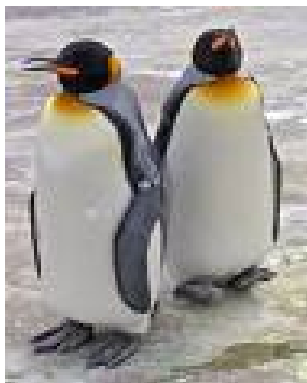
Slika 10: kraljevska pingvina

Je drugi največji pingvin. Mimogrede bi ga utegnili zamenjati s cesarskim. Vendar ima več oranžne barve na prsih, daljši kljun, vitkejše telo in živi na otokih severno od Antarktike.