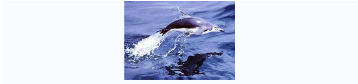
Slika 5: Plavalna tehnika delfinček

So izvrstni plavalci in potapljači, ki lahko dosežejo globino do 20 m. Uporabljajo tri različne tehnike plavanja: Pri prostem plavanju se zadržujejo na površini, poganjajo se s perutmi, glavo in rep pa držijo zunaj vode. Med lovom plavajo pod vodo in se poganjajo s silovitimi zamahi s perutmi, kot bi leteli. Plen pogoltnejo kar med plavanjem, pod vodo pa se zadržijo približno minuto. Najdaljši potopi trajajo celo do 20 minut. Pod vodo so pingvini tako spretni, da jim težko kaj uide. »Delfinček« - pingvini plavajo tik pod površino in od časa do časa skočijo iz vode, da zajamejo zrak.