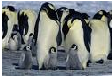
Slika 4: Pingvinji starši