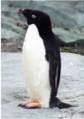
Slika 7: Adelijski pingvin

Spada med najnapadalnejše pingvine in hitro najde razlog za boj: stepe se za samico, primeren prostor za gnezdo, celo za kamenčke, napada pa tudi tuje mladičke. Je tudi zelo gibčen.