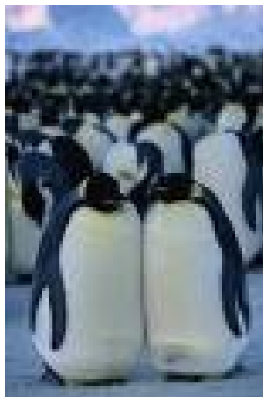
Slika 1: Čokato telo pingvina

Pingvini so ptiči, vendar ne letajo. Imajo čokato telo in kratke noge, ki izraščajo iz telesa povsem zadaj, tako, da na kopnem stojijo pokonci. Ravnotežje lovijo tudi s kratkim, čvrstim repom. Med prsti na nogah imajo plavalno kožico. Pri hoji prenašajo celotno težo telesa z enega podplata na drugega, zaradi česar se pri hoji zibljejo. Na snegu ali ledu se lahko dričajo po trebuhu, naprej pa se poganjajo z nogami in perutmi.