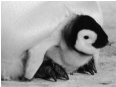
Slika 3: Varovanje mladiča