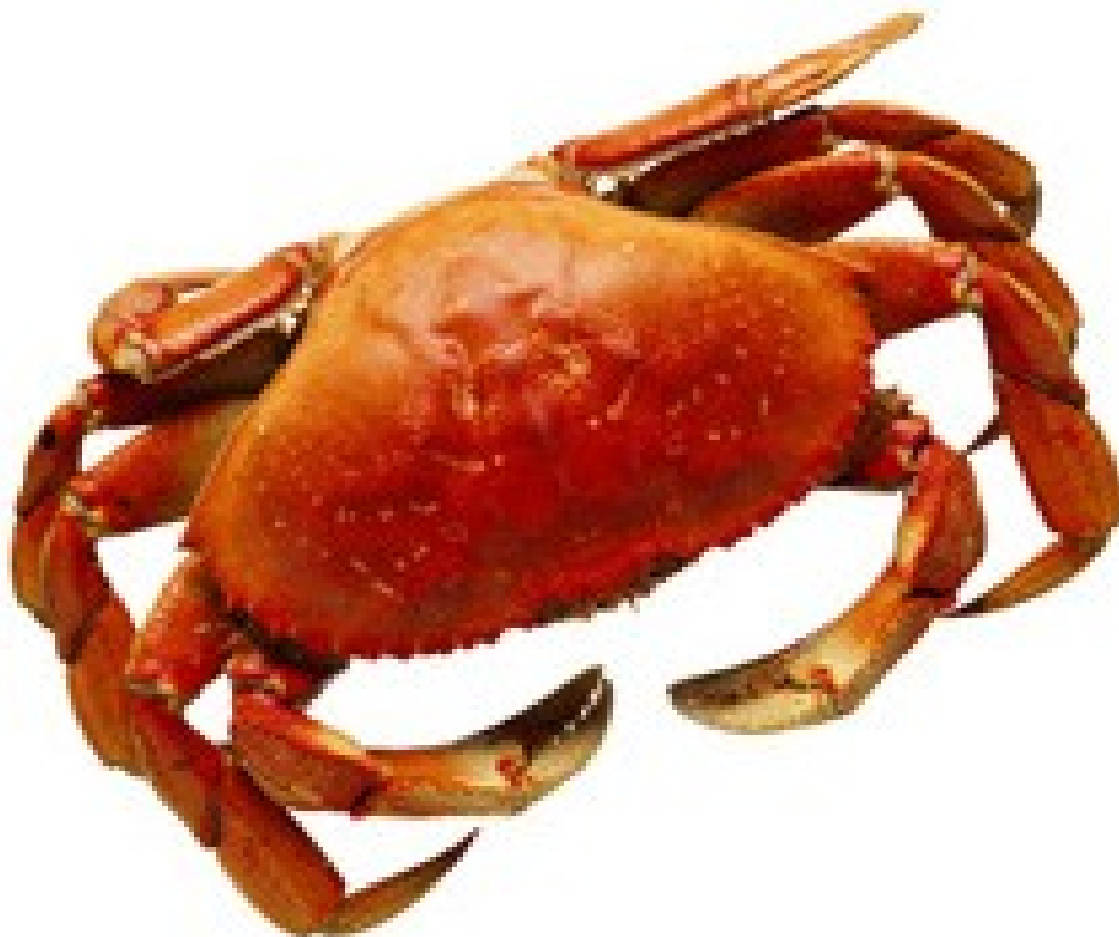
Slika 5: RDEČA RAKOVICA

Kot pri številnih skupinah žuželk je tudi pri rakih v življenjski cikel vključena preobrazba. Pri rakovicah samica varuje jajčeca, iz katerih se razvijejo lebdeče ličinke zoeje, ki jih odnese morski tok. Ličinke se med rastjo počasi spremenijo v ličinko, imenovano megalopa, ki se čez čas spusti na morsko dno in se počasi spremeni v majhno rakovico. Ti mladiči se potem odpravijo proti obalnim plitvinam in tam ostanejo do konca življenja.