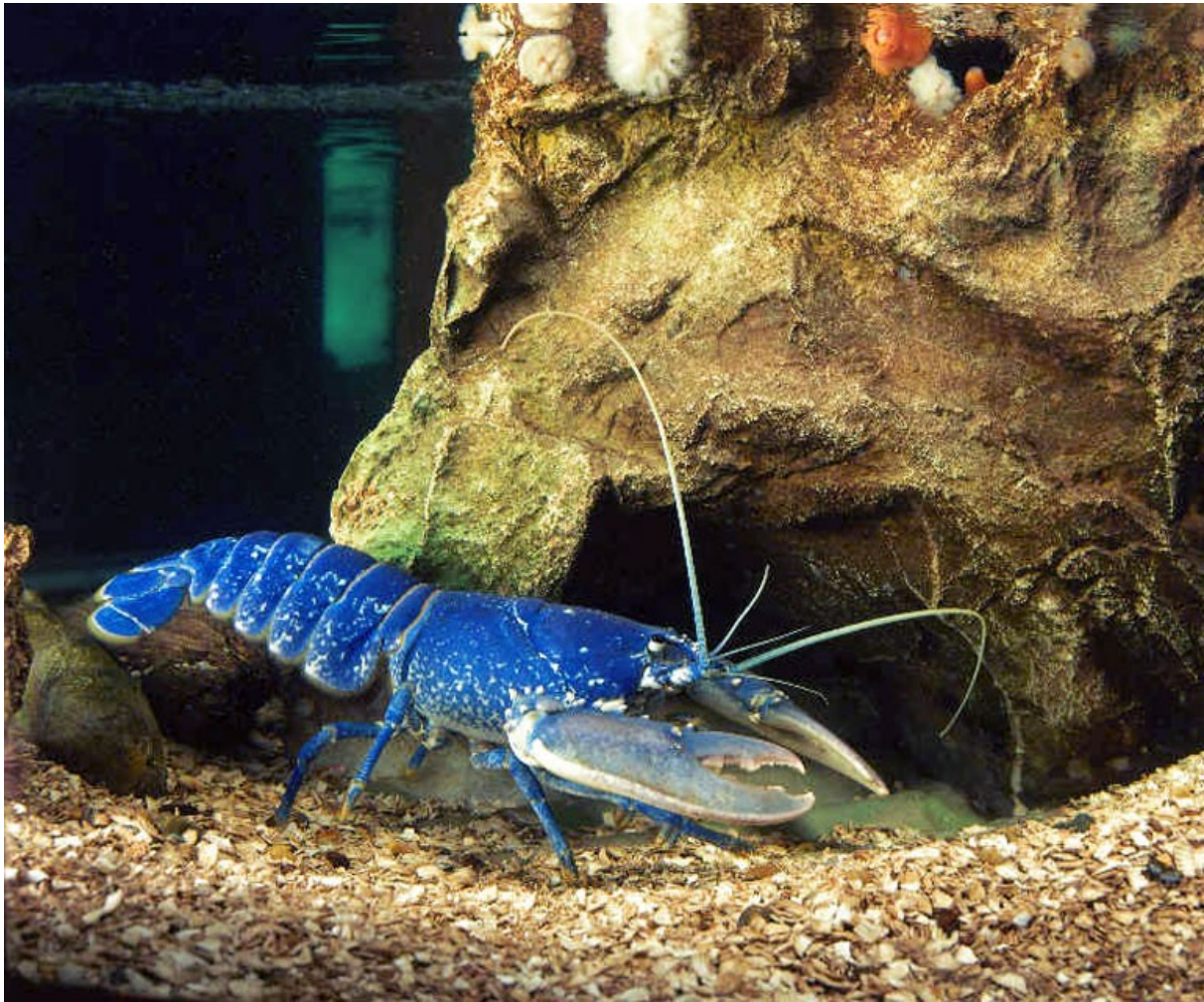
Slika 3: JASTOG

Pogosto so živobarvni in imajo trdo zunanje ogrodje utrjeno z apnencem. Oklep-če je razvit-je prostor za škrge. Pogosto imajo pecljate oči in izrazite tipalnice. Oprsje sestavlja do 8 členov, zadek pa ima 6 členov in sploščen pahljačast rep. Z njim lahko hitro zamahujejo in v nevarnosti odplavajo na varno.