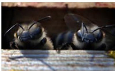
Slika 1 - Čebele pred izhodom iz panja

Propolis, je pridelek, ki ga čebele potrebujejo za lastno zdravje. Beseda propolis izhaja iz starogrškega jezika: pro ("pred") in polis ("mesto"), nanaša se na opazovanja čebelarjev, ko so si čebele v nekdanjih bivališčih zgradile steno iz propolisa pred vhodom v njihova gnezda. Po drugih virih pa iz latinske besede propoliso, ki pomeni zamazati, zagladiti. Slovenska beseda za propolis je zadelavina. Ta beseda najbolje označuje pomen te snovi v panju. Poleg tega, da z zadelavino mašijo luknje, pa predstavlja le-ta tudi zaščito pred mikrobi. Čebele prevlečejo z zadelavino vso notranjost panja; prevlečejo tudi notranjost celic v satju, preden matica vanje zaleže jajčeca.