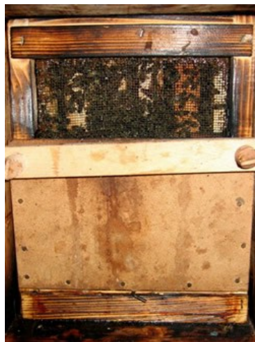
Slika 1 - AŽ panj