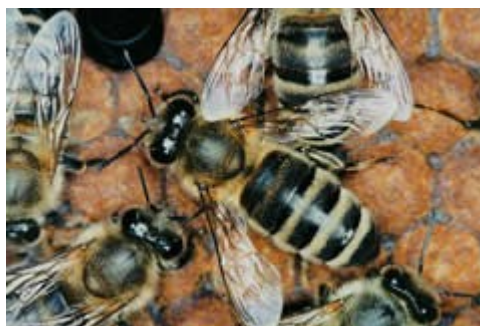
Slika 1 - Čebela delavka

nektar v med, ščitijo panj pred sovražniki in zamenjajo staro matico z novo, ko je to potrebno, ter ko je potrebno uničujejo trote. Čebela delavka ima daljši in bolj razvit rilček od matice in trota. Saj je nujno potreben za zbiranje nektarja in za hranjenje zalege. Za zbiranje in prenašanje cvetnega prahu in propolisa ima čebela na zadnjem paru nog posebne koške. Pri zaščiti pred sovražniki uporablja želo. Razvite ima žleze za gradnjo satja in čutila vonja, okusa, tipa, sluha in podobno.