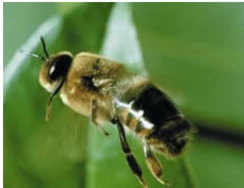
Slika 1 - Trot

Troti so čebelji samci. Družine prično zrejati trote pozno pomladi. Število trotov v družini je odvisno od moči družine in velikosti trotovskega satja. V običajni družini je na višku razvoja približno 1000 trotov. Troti v panju ne opravljajo posebnih del; grejejo zalego in so pomembni za normalno razpoloženje v družini. Pomembni so za selekcijo, saj prenašajo dedne lastnosti na potomce in sicer v prvi generaciji na matice in čebele, v drugi pa na trote. Po glavni ali jesenski paši čebele izženejo trote iz panjev, tako da družine preko zime nimajo trotov. Trot ima debelo telo, velika krila, okroglo glavo in dobro razvite oči. Dolžina trota znaša 17 mm, teža pa je okoli 200 mg, nima žela, in ima zelo kratek rilček. Troti živijo 60 dni. Iz panja izletijo po desetih dneh, ko postanejo spolno zreli.