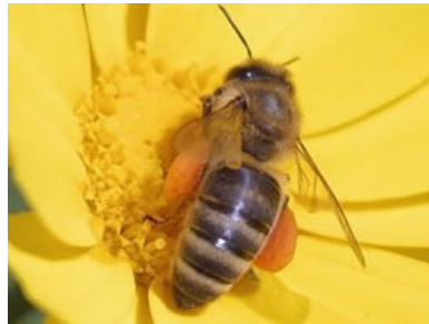
Slika 1 - Čebela pri nabiranju

Zrnca cvetnega prahu ali peloda se tvorijo v prašnicah višjih rastlin. Namenjena so spolnemu razmnoževanju rastlin in so nosilec moških spolnih celic. Pelod je proteinsko najbogatejši del rastline.