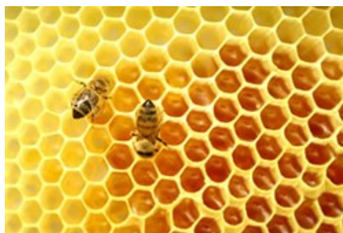
Slika 1 - Satje iz čebeljega voska

Čebele gradijo iz voska satje. V celice satja zalega matica, delavke pa vanje shranjujejo med in cvetni prah. Iz voska izdelujejo tudi voščene pokrovce, s katerimi pokrivajo celice, napolnjene z medom tako ga zaščitijo pred zunanjimi vplivi. Voskovne žleze imajo le čebele delavke. Najbolj so razvite med 12 in 18 dnevom starosti čebele.