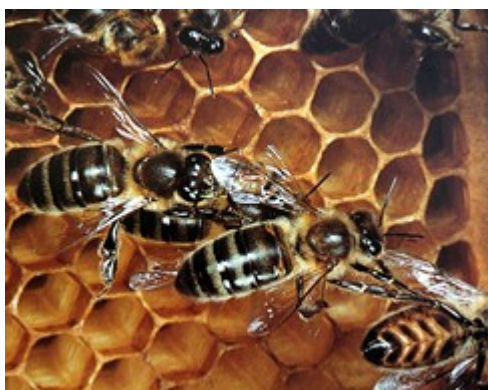
Slika 1 - Nemška čebela

Razširjena je po vsej Evropi severno od Alp, pa tudi v severnem delu Sovjetske zveze, v Sibiriji do Tihega oceana. Temne ali nemške čebele so zelo podobne čebelam z iberijskega polotoka, od koder so se po zadnji poledenitvi pomikale proti severu. Zaradi mešanja z drugimi pasmami in tudi zato, ker jo druge pasme močno izpodrivajo, najdemo čisto pasmo samo še v nekaterih območjih Španije, Francije, Poljske in Sovjetske zveze. Nekaj rodov («Nigra») imajo tudi v vzrejevalci v Švici, Avstriji in ZR Nemčiji.