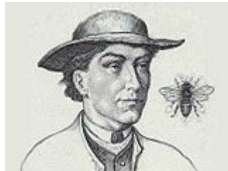
Slika 1 - Anton Janša

Sredi 18. stoletja so bili čebelarji dežele Kranjske zelo razgledani. Ljudje so poznali marsikatero skrivnost iz čebeljega življenja in se niso niti zavedali, da so v znanju vodilni v svetu. Ni čudno, da je iz tega okolja izšel čebelar, na katerega smo Slovenci ponosni še danes, to je bil prvi učitelj čebelarstva na Dunaju Anton Janša z Breznice pri Žirovnici.