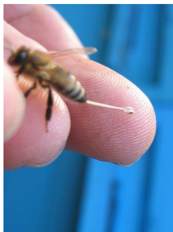
Slika 1 - Čebelji pik

Čebelji panj je za marsikatero žival velika skušnjava. Roparji v njem najdejo med, cvetni prah in zalego. Čebele ogrožajo miši, ose, sršeni pa tudi sosednje čebelje družine. Čebele so razvile učinkovit obrambni sistem. Pred vsiljivci se branijo s strupenimi piki. Želo se izdere in močan vonj privabi vedno nove čebele, ki pikajo vsiljivca. Čebele so se razvile v to smer, da nekaj sto žrtvovanih osebkov v skupnosti ne pomeni veliko, je pa usodno za večino manjših vsiljivcev. Želo živi izven čebele toliko časa, da mišičje iztisne vsebino celotnega strupnega mešička. Čebele strup v žival vbrizgajo s pomočjo žela. Z želom so opremljene le delavke in matica, troti ga nimajo. Čebela, ki piči se ji se ji skupaj z želom iztrga tudi tudi želno mišičje, zadnji del prebavne cevi z blatnikom in zadnji živčni vozelj, ki oživčuje želo in strupni aparat, čebela običajno kmalu pogine.