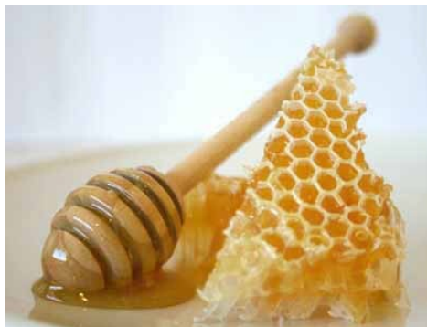
Slika 1 - Med

Med je živilo živalskega izvora. Med je naravna sladka snov, ki jo izdelajo čebele ( Apis mellifera ), iz nektarja cvetov ali izločkov iz živih delov rastlin ali izločkov na živih delih rastlin, ki jih čebele zberejo, predelajo z določenimi lastnimi snovmi, ter ga shranijo, posušijo in pustijo dozoreti v satju.