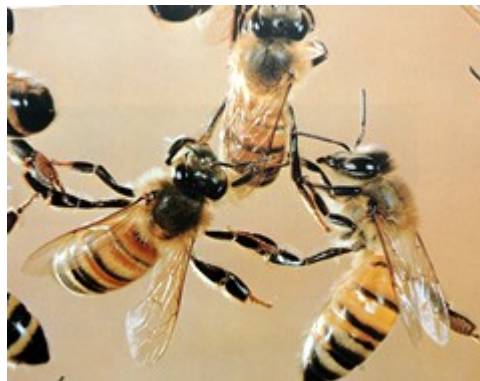
Slika 1 - Italijanska čebela

Ta čebelja pasma je razširjena na Apeninskem polotoku, kar pove tudi njeno ime. V zadnjih 100 letih se je zaradi izvoza čebel in matic zelo razširila po svetu, predvsem v ZDA, Avstralijo, Skandinavske dežele, Anglijo, Južno Ameriko in drugod. V teh deželah jo cenijo zaradi nekaterih lastnosti, ki so pomembne za industrijsko čebelarjenje. Italijanska čebela je nekoliko manjša od temne čebele, ima pa precej dolg rilček (6,3 do 6,6 mm). Hitin na zadku je svetel; na zadku ima 2 do 4 rumene obročke. Barva zadkovih obročkov pa se lahko spreminja od zelo svetlo rumene do temnejše rumeno rjave, tudi dlačice so rumenkaste.