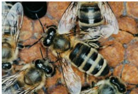
Slika 1 - Kranjska čebela