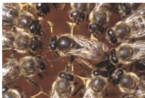
Slika 1 - Matica

Matica je mati vseh čebel in ima nalogo, da zalega jajčeca. Iz oplojenih jajčec se razvijejo čebele delavke, iz neoplojenih pa troti. Matica se razvije iz oplojenega jajčeca, kakor čebele delavke s to razliko, da je ona edina prava samica. Vzrok temu je hranjenje matice z matičnim mlečkom ko je v fazi žerke.