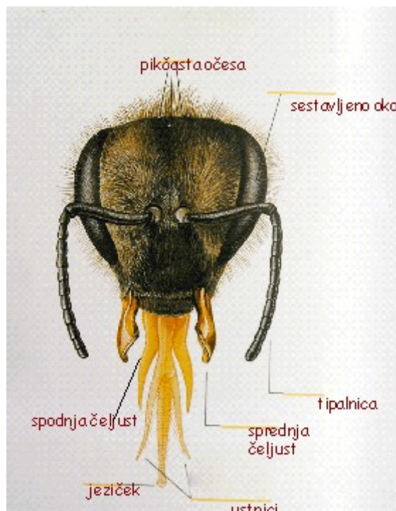
Slika 1 - Glava

vetrovnem vremenu ne najde poti na pašo ali nazaj v panj. Globinsko ostrino imajo slabo, zaznavajo kratkovalovno svetlobo. Vidijo tri osnovne barve: ultravijolčno, modro in rumenozeleno.