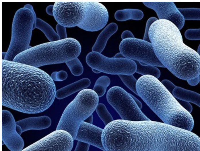
Slika 1- Mikroorganizmi