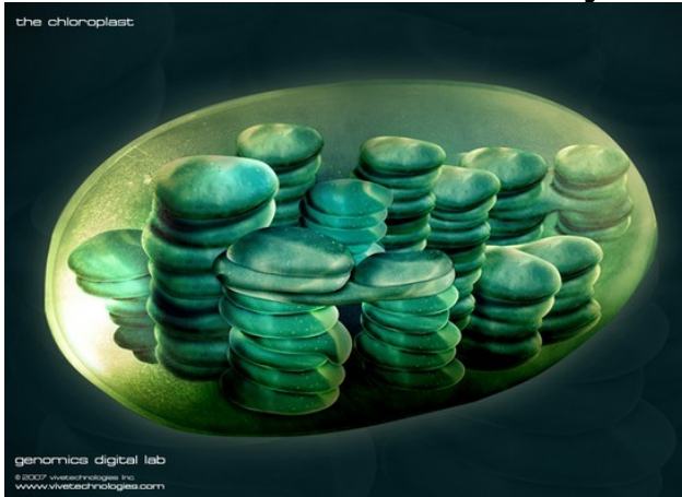
Slika 2: Kloroplast

V tilakoidnih membranah so molekule asimilacijskih barvil razporejene v posebnih skupkih, ki jih imenujemo fotosintetske enote. Fotosintetska enota vsebuje molekule klorofila a in klorofila b. Poleg klorofila pa so v fotosintetski enoti še druga barvila (oranžni karoteni in rumeni ksantofili). Vsaka fotosintetska enota vsebuje dva fotosistema, ki ju imenujemo fotosistem 1 in fotosistem 2. V fotosistemu 1 je klorofil a z absorpcijskim vrhom pri 700 nm, v fotosistemu 2 pa je klorofil a z absorpcijskim vrhom pri 680 nm