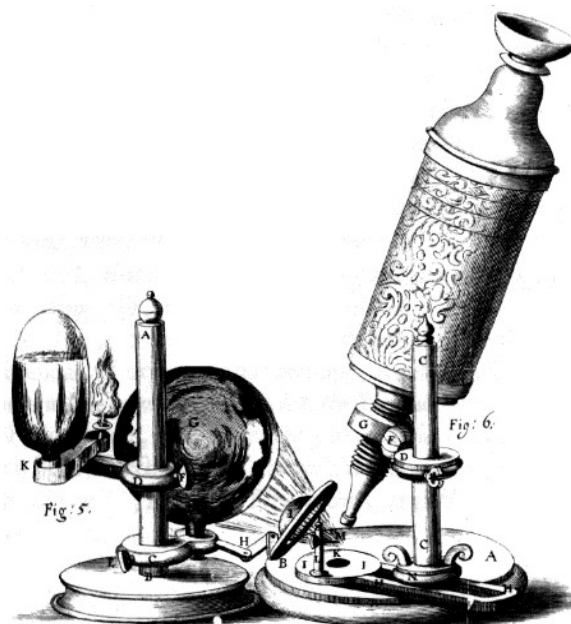
Mikroskop Roberta Hookea