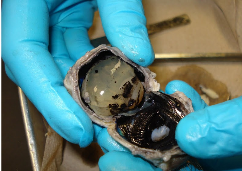
Slika 5: steklovina v razpolovljenem očesu

Pri opazovanju z živim očesom sem prav tako potrdila svojo hipotezo, da akomodacija očesa na spremembe v jakosti svetlobe in oddaljenosti predmetov traja nekaj časa.