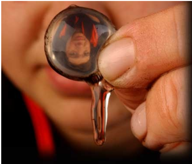
Slika 3: narobe obrnjena slika na leči

Pri drugem delu vaje sem opazovala prilagajanje očesa na jakost svetlobe in oddaljenost opazovanih predmetov, poleg tega pa sem preizkusila tudi slepo in rumeno pego. Lokacijo moje slepe pege sem našla s preprostim poskusom s svinčnikom; s prosto roko sem prekrila levo oko in nato svinčnik podržala kake tri decimetre stran od svojega desnega očesa. Pogled sem uprla v statično točko pred menoj in svinčnik premikala dokler ni izginil iz mojega vidnega polja; na tisti točki na moji mrežnici je moja slepa pega.