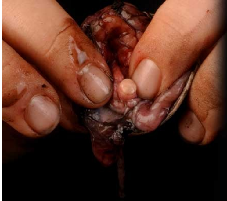
Slika 4: vstopno mesto optičnega živca

Poleg steklovine, ki je iztekla, ko sem razpolovila oko, svetlobne žarke pomaga lomiti tudi prekatna tekočina, za katero sem ugotovila da se nahaja med roženico in šarenico in ohranja konveksno obliko prve, kar še dodatno pomaga pri zbiranju svetlobnih žarkov. Preden sem odstranila lečo sem si ogledala tudi mišice ciliarnika in vlakna, ki so jih povezovala z lečo. Za to sem ugotovila da je na površini mehka, v sredici pa trda, ter jo po preizkusu s časopisnim papirjem in oddaljenim predmetom tudi zmečkala, da bi si lahko podrobneje ogledala njeno strukturo.