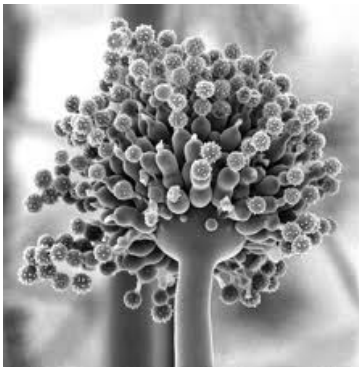
Slika: Aspergillus niger

22. Plesni iz rodu Aspergillus zaradi spremembe pH v gojišču spremenijo metabolni produkt (glavni končni produkt dihanja). Če je v gojišču kisli pH, je končni produkt vrenja