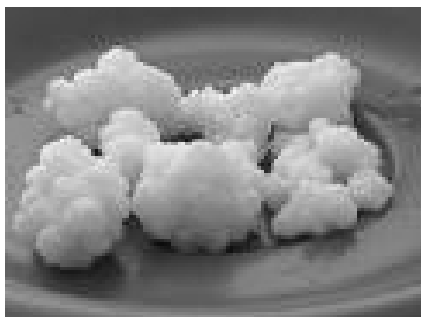
Slika 1: Kefirno zrno

Kefirno zrno je sestavljeno iz sesirjenega mleka, v katerega so ujete bakterije in kvasovke.