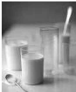
Slika 2: Kefirni napitek