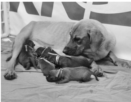
Klonirani psički

Prvi klonirani pes, ki ga je 'ustvarilo' podjetje RNL Bio, je bil Snuppy.