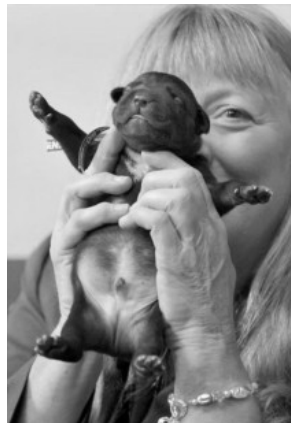
Američanka je od veselja 'čisto iz sebe' ...