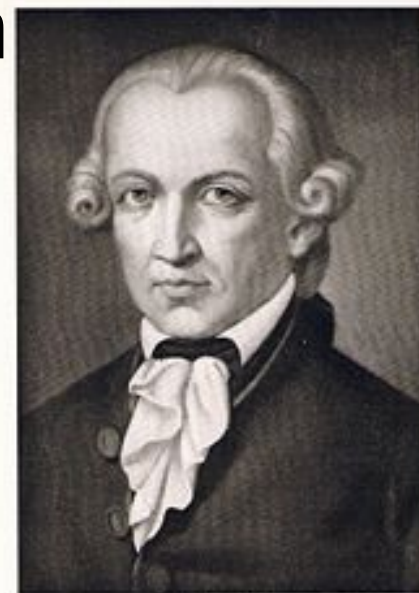
IMMANUEL KANT 1724-1804

✦ Kant je eden izmed najvplivnejših modernih filozofov. Velja za začetnika t.i. Nemške klasične filozofije (tudi znane pod imenom "nemški idealizem").