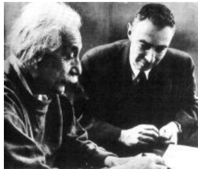
Albert Einstein in Oppenheimer

Julius Robert Oppenheimer je bil ameriški fizik, ki se je rodil 22. aprila 1904 v New Yorku in umrl 18. februarja 1967 v Princetonu. Izhajal je iz premožne in kultivirane družine. Že v zgodnji mladosti je izkazal izredno bistrost. Šolal se je na znani Ethical Culture School v New Yorku in končal šolanje kot prvi v razredu. Leta 1922 se je vpisal na Univerzo Harvard, kjer je diplomiral pri P. W. Bridgmanu v treh letih z najvišjimi ocenami. Podiplomski študij je opravil v Angliji, kjer se je srečal s Thompsonom, Rutherfordom in Bornom.