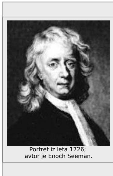
Portret iz leta 1726; avtor je Enoch Seeman.

S Principio je Newton takoj mednarodno zaslovel. Čeprav so bili kontinentalni znanstveniki zvesti mehanicističnemu idealu vsaj še eno generacijo, pa niso mogli nasprotovati nenavadnem uspehu Newtonovih računskih napovedi. Mladi britanski znanstveniki so si ga počasi vzeli za vzor. V kratkem času so vsa pomembna mesta na univerzah zasedali mladi Newtonovi privrženci. Newton, čigar najbližji odnos z žensko je bilo ponesrečeno razmerje z materjo, je našel zadoščenje kot vodja skupine mladih znanstvenikov. Razmerje s Fatiom de Duillierom, švicarskim matematikom, živečim v Londonu, ki je imel podobne nazore, je bilo eno najglobljih doživetij njegovega odraslega življenja.