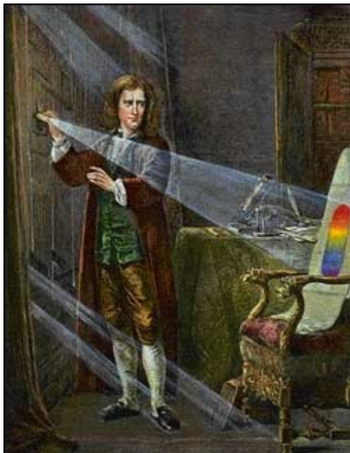
Newton raziskuje sestavo svetlobe.

Iz zapisov v Quaestiones lahko sklepamo, da je podrobno proučil celotnega Descartesa in veliko bral atomista Pierra Gassendija, vendar z njunimi dognanji nikoli ni bil v celoti zadovoljen. Skozi spise cambridgeškega platonista Henryja Mora je odkril hermetično tradicijo, ki je svet razlagala z alkemičnimi in magičnimi pojmi. Antagonizem med obema glavnima predstavama o svetu in naravnih pojavih v njem, med "mehanično" in "hermetično" tradicijo, je vseskozi vplival na njegovo razmišljanje in predstavljal ključni problem njegove celotne znanstvene kariere.