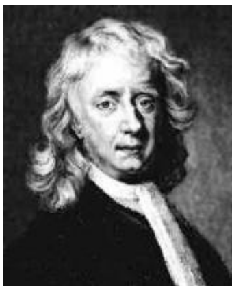
Portret iz leta 1726; avtor je Enoch Seeman.

S Principio je Newton takoj mednarodno zaslovel. Čeprav so bili kontinentalni znanstveniki zvesti mehanicističnemu idealu vsaj še eno generacijo, pa niso mogli nasprotovati nenavadnem uspehu Newtonovih računskih napovedi. Mladi britanski znanstveniki so si ga počasi vzeli za vzor. V kratkem času so vsa pomembna mesta na univerzah zasedali mladi Newtonovi privrženci. Newton, čigar najbližji odnos z žensko je bilo ponesrečeno razmerje z materjo, je našel zadoščenje kot vodja skupine mladih znanstvenikov. Razmerje s Fatiom de Duillierom, švicarskim matematikom, živečim v Londonu, ki je imel podobne nazore, je bilo eno najglobljih doživetij njegovega odraslega življenja.