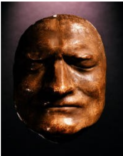
Newtonova posmrtna maska; original hrani Royal Society.

V zgodnjih devetdesetih letih 17. stoletja je poslal Locku kopijo rokopisa, v katerem je poskušal dokazati, da so deli Svetega pisma, ki govorijo o sveti Trojici, potvorbe izvirnega teksta. Ko je Locke poskušal sestavek objaviti, se je Newton zbal, da bi zaradi svojih kontroverznih stališč zabredel v težave, in sestavka ni dovolil natisniti. V kasnejših letih je veliko časa namenil interpretaciji Danijelovih in Janezovih pridig ter kronologiji starih kraljestev. Obe deli so objavili šele po njegovi smrti.