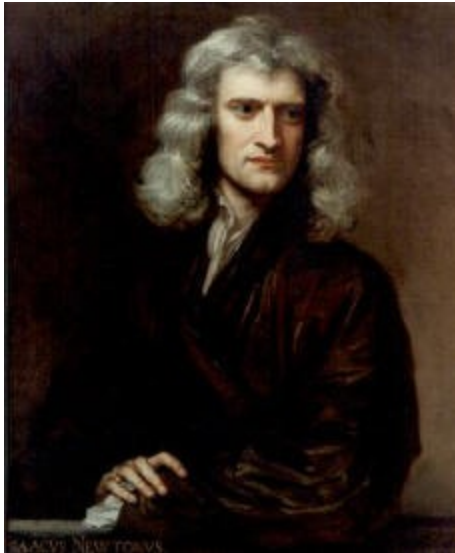
Portret iz leta 1689, ko je bil star 46 let (dve leti po objavi Principie ). Naslikal ga je Godfrey Kneller.

Januarja leta 1684 so Edmond Halley, Christopher Wren in Robert Hooke skupaj kosili v neki Londonski gostilni in se pogovarjali o astronomiji. Halley in Wren sta bil prepričana, da lahko Keplerjeve zakone izpeljeta iz gravitacijske sile, ki pada s kvadratom razdalje. Hooke jima je nazaj zatrdil, da je to že enkrat dokazal, vendar njegove besede niso zvenele prepričljivo, zato mu je Wren ponudil nagrado, če mu prinese dokaz v dveh mesecih, kar pa mu ni uspelo.