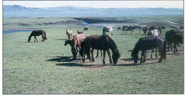
(Vir: Senegačnik, J., 2002: Obča geografija , str. 111. Modrijan. Ljubljana)