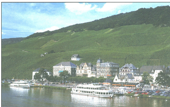
Priloga 5 / 5. sz. melléklet

(Vir: Natek, K. in M., 1999: Države sveta 2000, str. 118. Mladinska knjiga. Ljubljana)