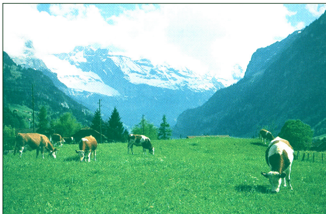
Priloga 4 / 4. sz. melléklet

(Vir: Bola Zupančič, K., in drugi, 2002: Geografske značilnosti Evrope, str. 53. Mladinska knjiga. Ljubljana)