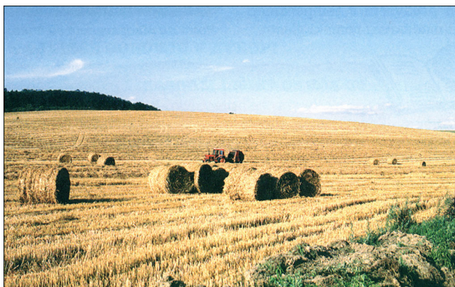
Priloga 6 / 6. sz. melléklet