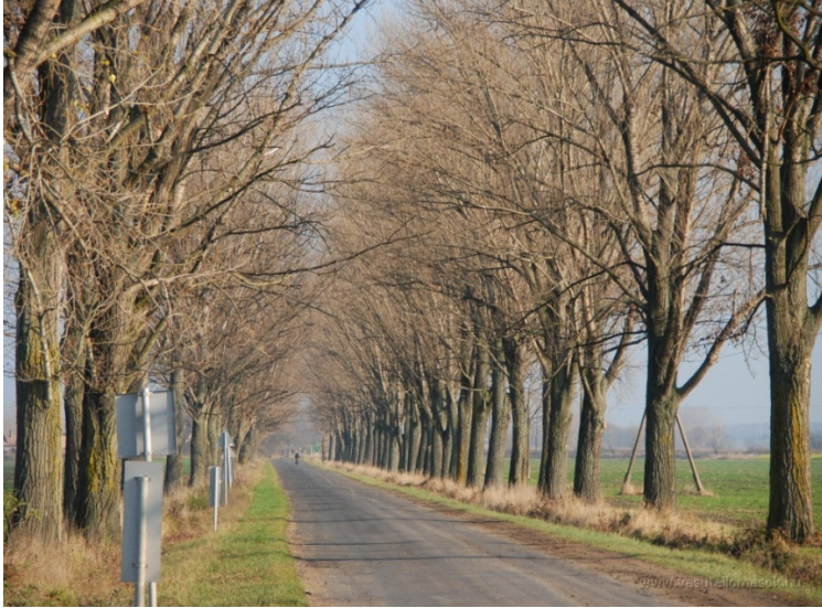
Slika 1 / 1. sz. kép

Pojasnite, zakaj so take ravne vrste dreves ob njivah in cestah v mnogih delih pokrajine Alföld.