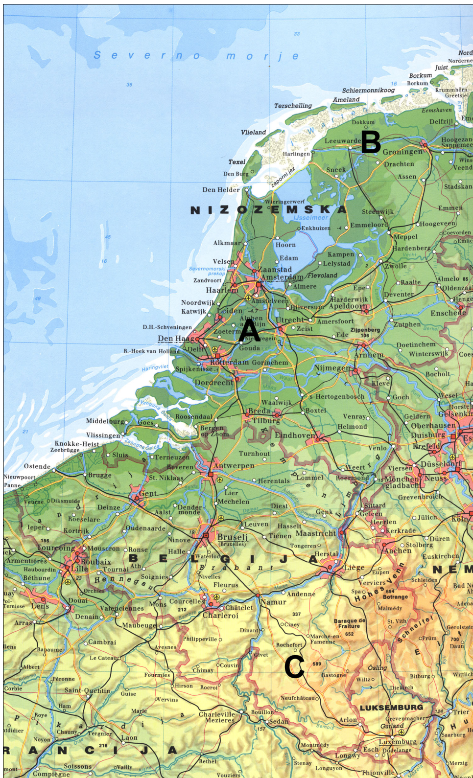
(Vir: Atlas sveta za osnovne in srednje šole, str. 56. Mladinska knjiga. Ljubljana, 1997)