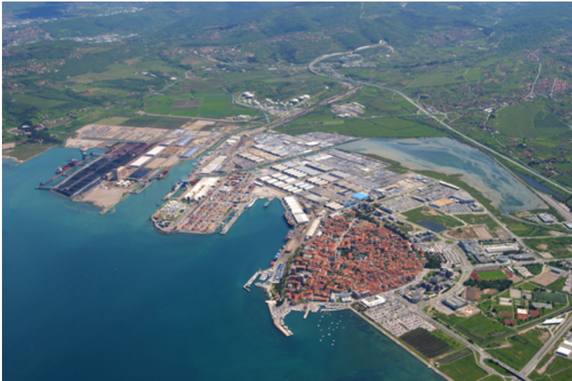
Slika 3: Luka Koper/3. sz. kép: A koperi kikötő