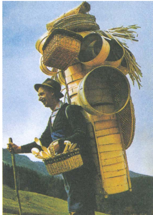
Slika 2/2. sz. kép:

Vir/ Forrás : Kastelic, A., Škraba, G., 2007. Spoznavajmo zgodovino: Zgodovina za 6. razred osnovne šole. Učbenik, Ljubljana, Modrijan, str. 27