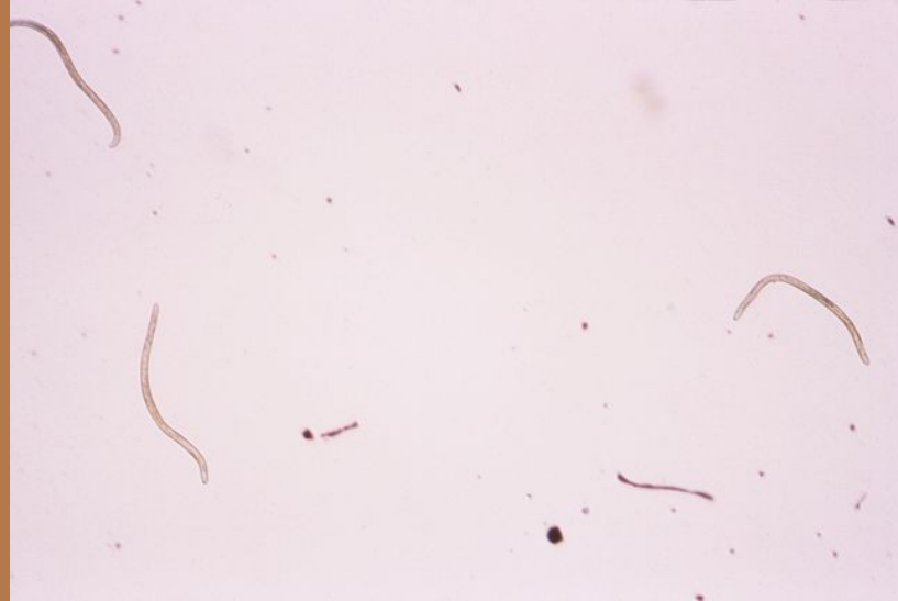
Gliste, ki povzročajo rečno slepoto