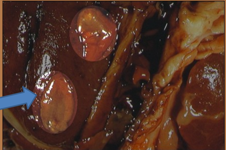
Ploskvi črvi metljaja na govejih jetrih