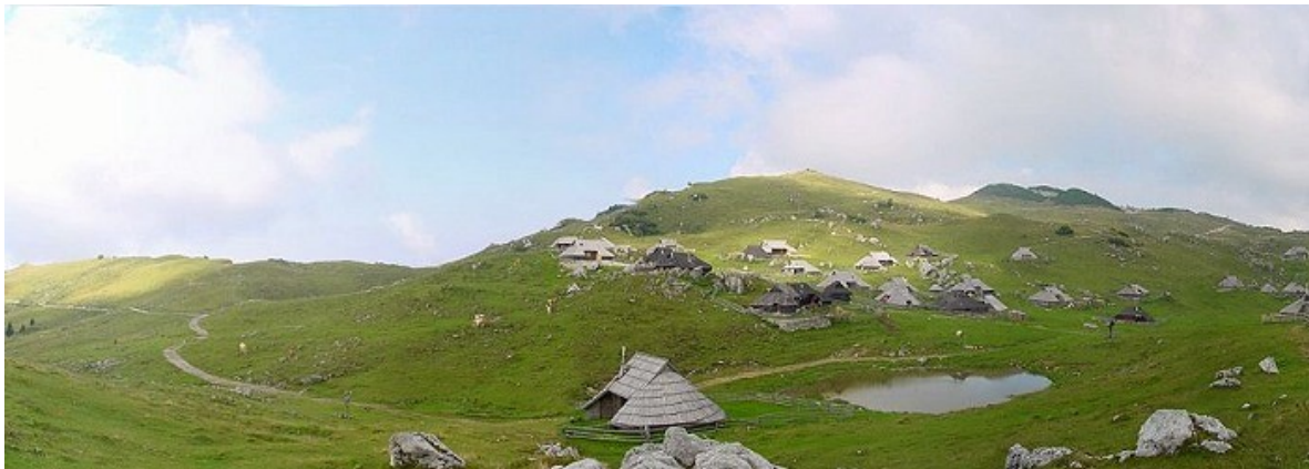
Pastirko naselje-velika planina

Pastirska naselja so v teh pokrajinah zelo pogosta. Drugače se imenujejo še planšarije.