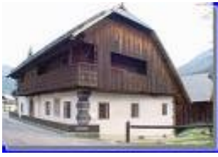
pristna alpska hiša