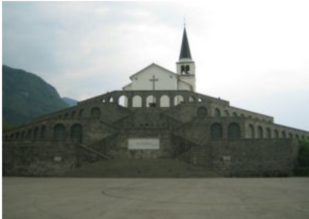
Kostnica nad Kobaridom

Italijanska kostnica nad Kobaridom , spomenik pri cerkvi sv. Antona padlim italijanskim vojakom v prvi svetovni vojni, Kobarid