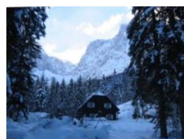
Koča v Krnici