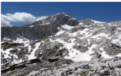
Slika3: Kamniško-savinjske Alpe