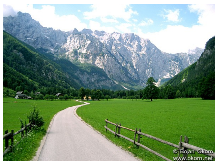
Slika14: Logarska dolina