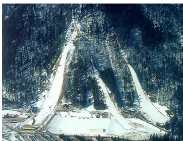
Slika6: Planica KARAVANKE