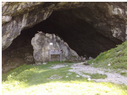
Slika12: Potočka zijalka