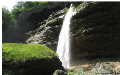
Slika5: slap Peričnik