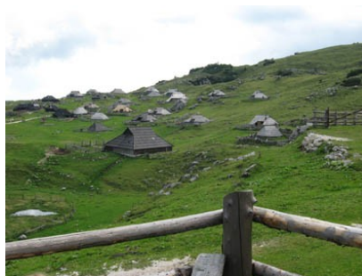
Slika13: Velika planina