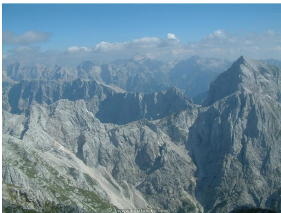
Slika1: Julijske Alpe

Čeprav je ta svet videti kot precej sklenjeno, mogočno gorovje, je v bistvu dokaj razčlenjen. V Alpskem svetu so obsežni gozdovi. So zelo pomembni, saj preprečujejo plazove, varujejo zemljo pred odnašanjem in vplivajo na podnebje, hkrati pa so zakladnica lesa in gozdnih sadežev ter prebivališče številnih živali.