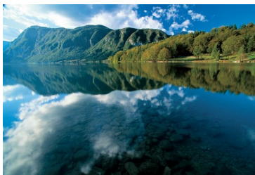
Slika4: Bohinjsko jezero

Ledeniške doline so: Planica, Vrata, Dolina reke Radovne, Trenta.