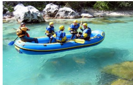
Slika9: Sava dolinka