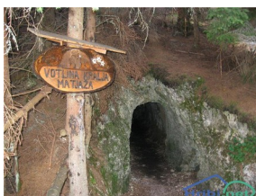
Slika16: Votlina kralja Matjaža

Novomašniki so kmalu za tem brali prvo mašo v novi kapelici s tremi oltarji, zakleta Veronika pa še danes čuva tri kadi zlatnikov in jih ponuja tistemu, ki jo bo rešil.