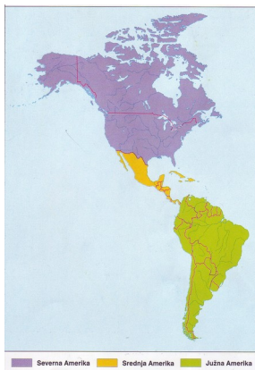
Slika 4 : Delitev Amerike

delimo Ameriko na dve celini, Severno 1 in Južno Ameriko, ki ju povezuje nenovnan Srednja Amerika 2 . Pojma Angloamerika in Latinska Amerika kolonizatorjev. Jezika kolonizatorjev Angloamerike sta bila v največji meri najširšem delu francoščina, medtem ko sta španščina in portugalščina prevladujeta v južnem delu. To je tudi pojem latinska Amerika.