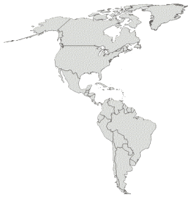
Slika 3 : Amerika

Amerika je skupno ime za vse tisto kopno, ki se razprostira med Atlantskim in Tihim oceanom, daleč vstran od drugih celin. Zaradi te osamljene lege je ameriško kopno postalo znano preostalemu svetu šele na pragu 16. stoletja. Ime je dobila po enem izmed svojih raziskovalcev Amerigu Vespucciju.