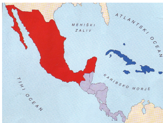
Slika 8 : Delitev srednje Amerike

Srednja Amerika leži med Severno in Južno Ameriko. Delimo jo na Mehiko, Medmorsko in Antilsko Ameriko.