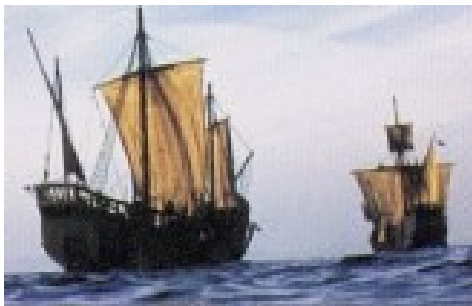
Slika 1: Ladji Pinto in Santa Marija