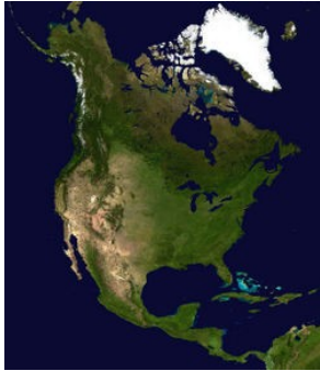
Slika 5 : Severna Amerika

Angloamerika se razprostira od severnih ledenih arktičnih otokov do južnih tropskih krajev Latinske Amerike. Njena površina je večja od 20 milijonov km 2 . Na severnoameriški celini ležijo tri države: Kanada, ZDA 4 in Mehika. Severna Amerika na severu meji na Severno ledeno morje in na Beringovo morje, na zahodu na Tihi ocean, na vzhodu na Atlantski ocean, na jugu pa meji s srednjo Ameriko.