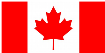
Slika 7: Zastava Kanade

Kanadska zastava je rdečo bele barve in v sredini ima javorjev list. Včasih so iz javorja pridobivali sladkor in sirup.