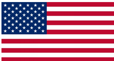
Slika 6 : Zastava ZDA

Njeno uradno ime je United States of America ali po naše Združene države Amerike. Glavno mesto ZDA je Washington. ZDA zavzemajo 9.518.898 km 2 in so tretja največja država na svetu po površini. Prebivalstva je skupaj 270.262.000.