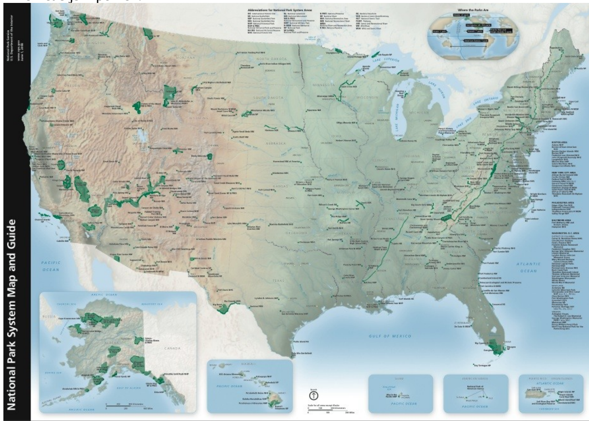
Slika vseh narodnih parkov v Ameriki.

Narodni park je večje, naravno zaokroženo, pretežno prvobitno zavarovano pokrajinsko območje z izrednimi naravnimi značilnostmi, ki imajo poseben narodni, kulturni, znanstveni in rekreacijski pomen.