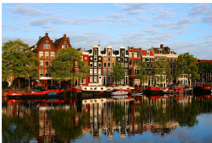
Slika 1: hiše ob reki Amstel

Amsterdam ima 725.000 prebivalcev. Ime je dobil po prvem jezcu na reki Amstel, ki so ga okoli leta 1000 zgradili, zaradi melioracije predela, ki je bil pokrit z morjem. Mesto je v celoti zgrajeno na kolih in leži pod morsk gladino.