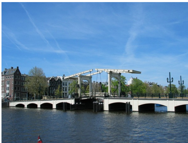
Slika 9: most Magere

Amsterdam ima več kot sto mostov, a Magere most (v prevodu Suhi most) je njegov najznamenitejši. Povezuje bregova reke Amstel in se dvigne vsakih dvajset minut, da skozi spusti ladje. Prvotni Magere most je bil zgrajen leta 1670, a je bil zaradi hitrega razvoja transporta na reki Amstel hitro zamenjan