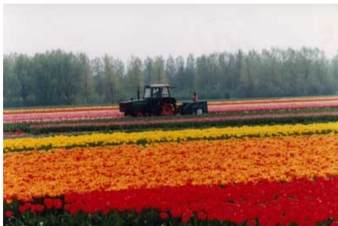
Slika 6: nasaja tulipanov

Mesto je znano po veliki pridelavi tulipanov. Polja nasajena s tulipani dosežejo dolžino tudi kilometra. Zaradi stalne vlage in sorazmerno toplih zim zlasti lepo uspevajo bujni pašniki in listnati gozdovi, ki so jih večinoma že izkrčili. Nizozemci so rastlinski pokrov svoje dežele popolnoma spremenili. Posebno pokrajina polderjev je kultivirana in spremenjena v poljedelsko – živinorejsko obdelovalno zemljišče. Prvotno rastje polderjev je bilo vresje, ki najbolje uspeva na peščenih tleh.