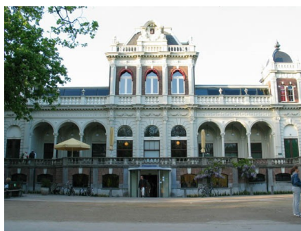
Slika 10: Filmski muzej