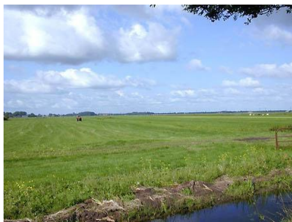
Slika 3: polderji

Polderji so z nasipom zavarovani, iz morja pridobljen svet. Mokrotno pridobljena območja so začeli izsuševati že v 13. stoletju. Danes so to rodovitni marši in polderji. Skoraj ves severni del oziroma četrtnina države leži nekaj metrov pod vodno gladino, danes so to izsušena področja na katerih pridelujejo svetovno znane tulipane.