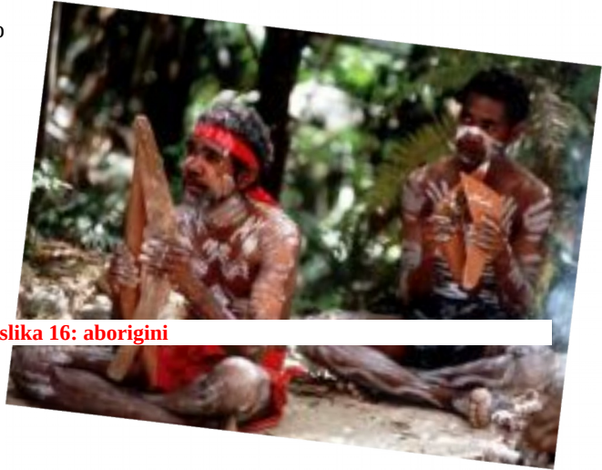
slika 16: aborigini

Danes predstavljajo le 2% prebivalstva. Veliko aboriginov je postalo brezdomcev nekaj pa jih živi v rezervatu kjer poskušajo ohraniti vsaj kanček običajev in verovanj.