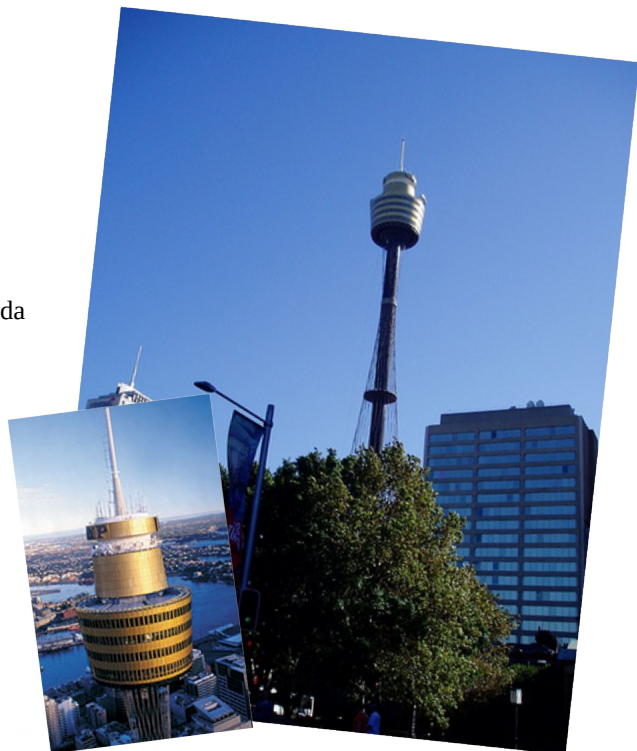
slika 10: Sydney tower

Je drugi najvišji stolp v avstraliji visok kar 305 metrov kar pomeni da je enako visok kot Eiffelov stolp v Parizu. Da pa Sydney tower malo poživijo priredijo run-up izziv kdo prvi preteče 1504 stopnic. Rekord pa je 6min in 52 sekund. Razgled s stolpa je očarljiv. S stolpa lahko vidite Sydney in na stregah veokoliških stavb boste zagledali celo bazeno. Najvišji stolp pa je še v gradnji imenoval se bo Gold Coast ali q1 in bo bil visok kar 323 metrov.