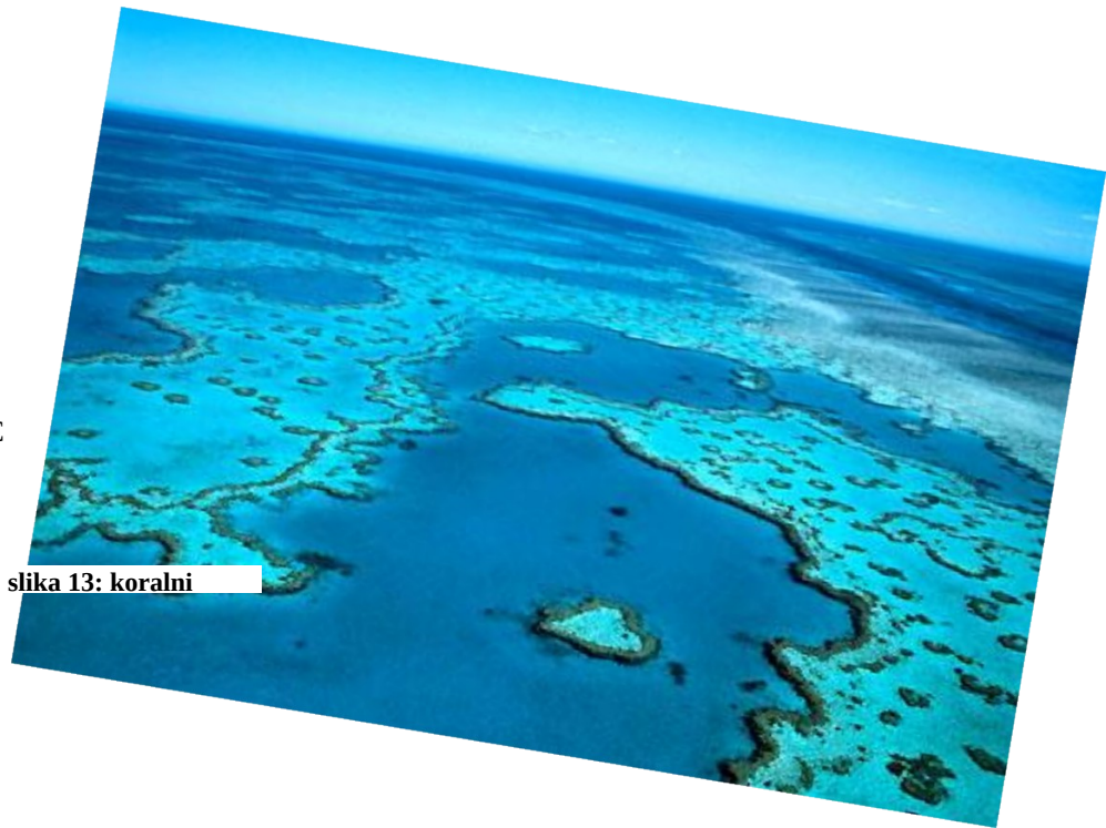
slika 13: koralni

Veliki koralni greben je velik kar 2500 km in nastaja v morji ki so globoki do 45 m. pomembno je tudi da je voda čista in ima 21°C. Koralni greben je eden izmed največjih in najlepših na svetu, na njem najdemo kar 400 vrst koral in 1500 vrst rib. Predstavlja pa problem za ribiče in druge ladje saj obstaja