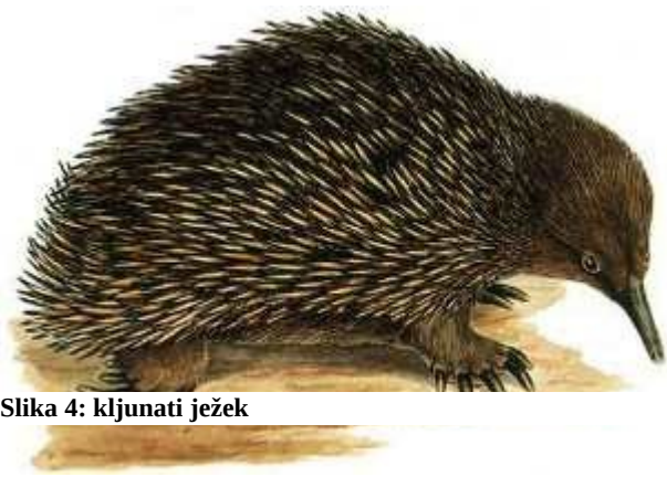
Slika 4: kljunati ježek

kljunati ježeki so eni najstarejših sesalcev saj živijo že 200 mio let in so zato živi fosili, so majhni in imajo bodice v nevarnosti se zvijejo v klopčič tako kot navadni jež. Ležejo jajca s kožasto lupino, valijo pa v trebušni votlini