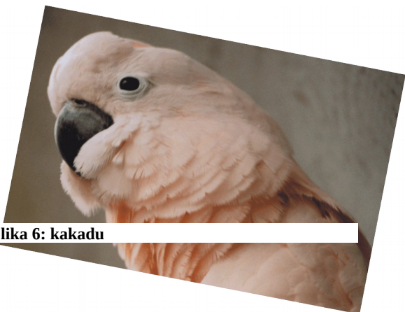
Slika 6: kakadu

Med pticami sta posebnosti rožnati kakadu in pa tekač emu