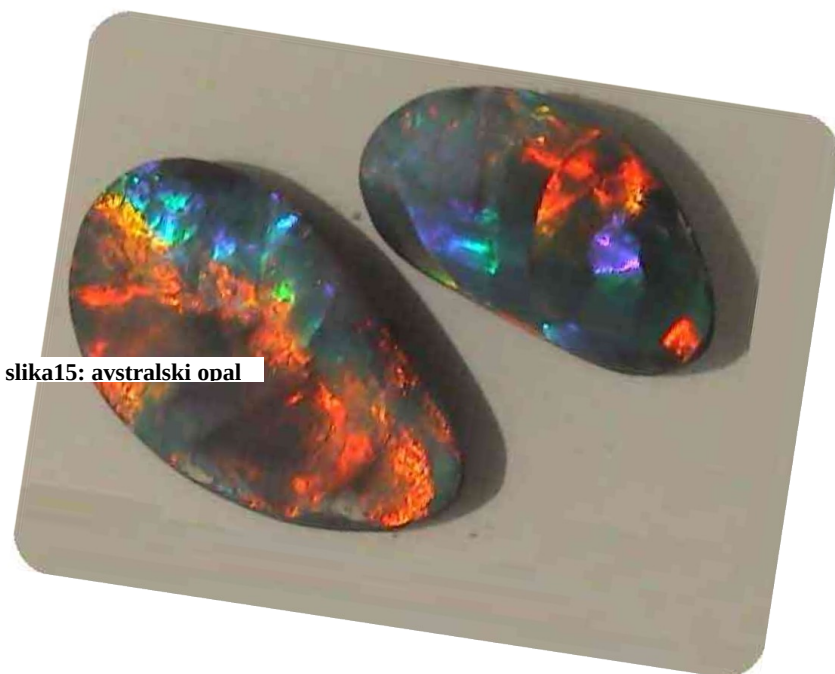
slika15: avstralski opal

Ima zelo dobro razvito industrijo orožja vozil in strojev, Farmacije, tekstila. Sedaj pa se pospešeno razvija elektrotehniška industrija