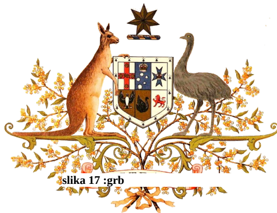
slika 17 :grb

Ta je med obema svetovnjima vojnama podprla svojo matičnodomovino.Leta 51 je podpisala varnostni sporazum z ZDA in Novo Zelandijo (ANZUS). OD leta 83 je vladala Laburistična stranka ki si je prizadevala za obvladati strukturno gospodarsko krizo in povečati mednarodno konkurenco.Obnovila je odnose s indonezijo in Kitajsko.91.je aktivno sodelovala v zalivski vojni v Iraku. V sedanosti se Zevezna vlada zavzema za spoštovanje kršenih pravic in diskriminiranih aboriginov. Z indonezijo je uredila meje na morju in pa razdelila sta si naftna nahajališča.