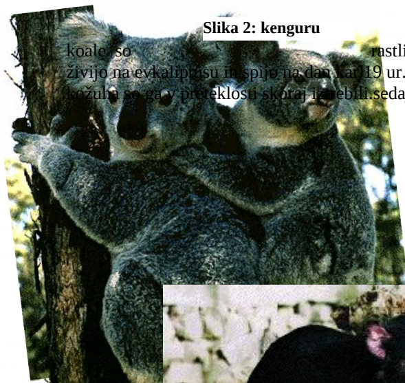
Slika 1 koali na drevju

koale so živali ki živijo na evkalipisu in spijo na dan kar 19 ur. Zaradi kožuh so ga v preteklosti skoraj izrežili, sedaj pa je lov na njih prepovedan.