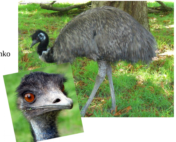
slika 7: emu

Emu je ptica ki ne leti in ima prilagojene noge za tek. V nevarnosti lahko teče tudi 50 km/h. Leže velika jajca s katerimi se ljudje tudi prehranjujejo. Emu je gojimo tudi v Sloveniji