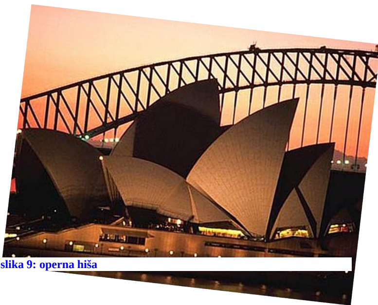
slika 9: operna hiša

s pristanišča opera izgleda kot labod poleteti. Streha opere je zgrajena iz belih granitnih plošč ki se naj bi same čistile, kljub temu jih morajo učistiti in zamenjati. V notranjosti je iz Rožnatega granita.