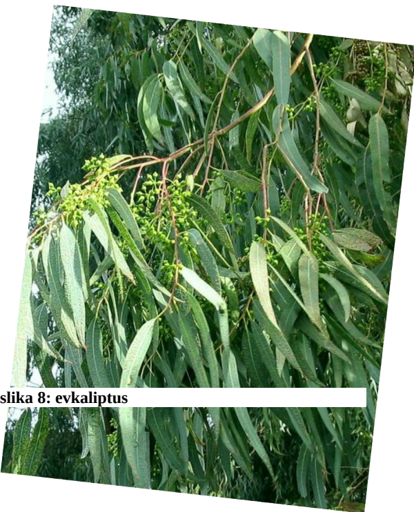
slika 8: evkaliptus