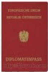
Potni list Avstrije

Avstrija velja za deželo festivalov in koncertov z vrhunskimi umetnostmi dosežki, hkrati pa tudi za deželo sproščene radoživosti in črnega humorja. Dunaju se še zdaj pozna, da je bil nekoč prestolnica cesarstva s številnimi narodi, med katerimi so imeli večino slovanski. Takrat ni presenečalo, da je bilo po njegovih ulicah slišati toliko različnih jezikov, kakor v nobeni drugi evropski prestolnici. Na Dunaju so živele velike skupine Čehov, Madžarov, Slovencev, Srbov in drugih-današnji Dunajčani so pisana mešanica potomcev najrazličnejših prednikov.