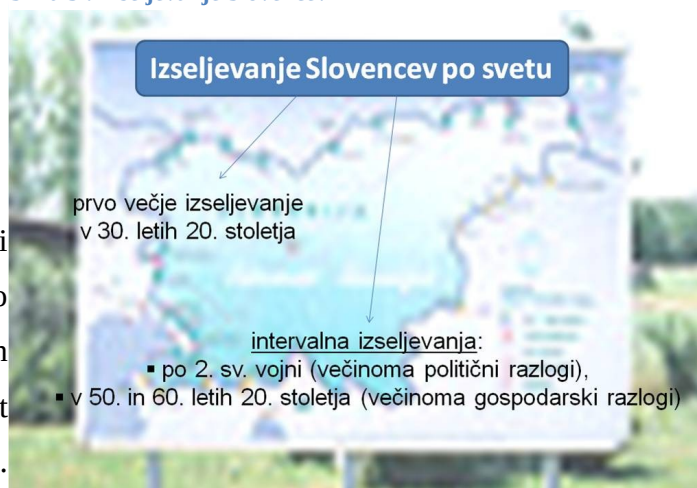
Slika 3 : Izseljavanje Slovencev

vedno iskali boljše življenje v tujini. Velika večina ljudi je svojo prihodnost iskala v “obljubljene deželi” oz. Združenih državah Amerike, nekateri pa tudi v Kanadi, Braziliji, Argentini po prvi sv. vojni celo v zahodni Evropi in drugod po Evropi. Ljudje so vedno iskali