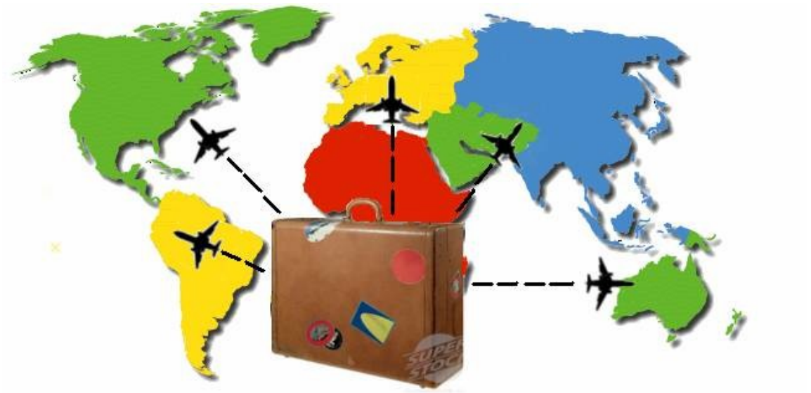
Slika 4 : Migracije 1

Pri meddržavni selitvi poznamo 3 tipe migracij: