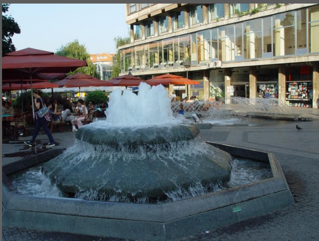
Knez Mihajlova ulica.