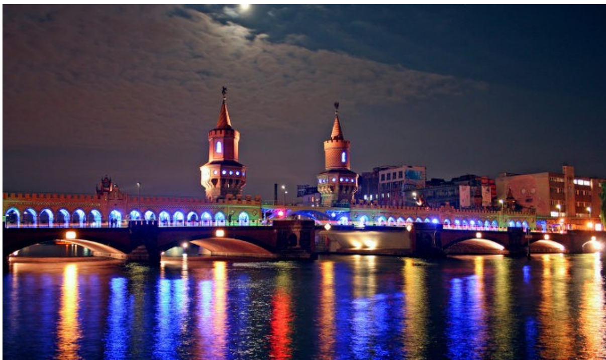
Slika 9: Festival luči

Festival luči je Berlin organiziral od 10. do 19. oktobra 2014. Za to priložnost so bile znamenite stavbe zelo zanimivo osvetljene.