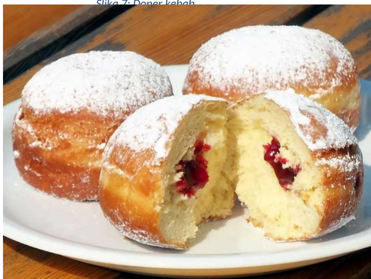
Slika 8 Krofi- Berlinerji

http://www.germany.info/contentblob/2599068/Galeriebild_gross/667385/Doener_Kebab_dpa.jpg