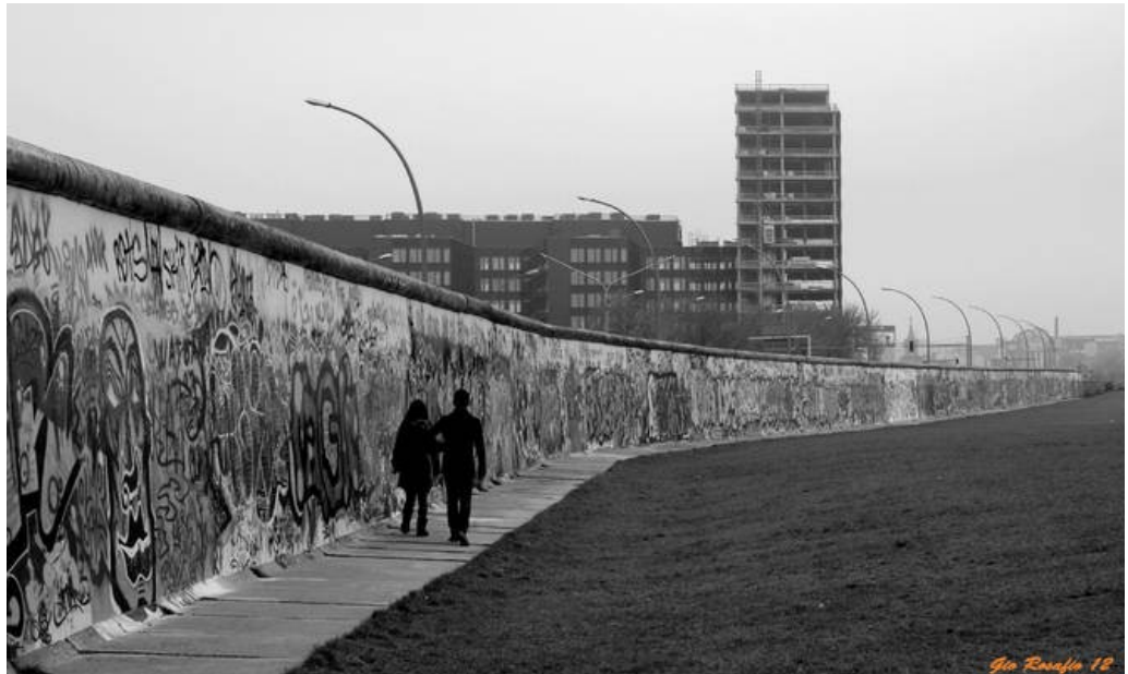
Slika 5: Berlinski zid

zvezo. Mejo med Zahodno in Vzhodno Nemčijo so sprva nadzirali le policisti, kasneje pa so na vzhodni strani postavili še ograjo. Takrat je bil Berlin uradno neodvisen od vzhodne in zahodne države.