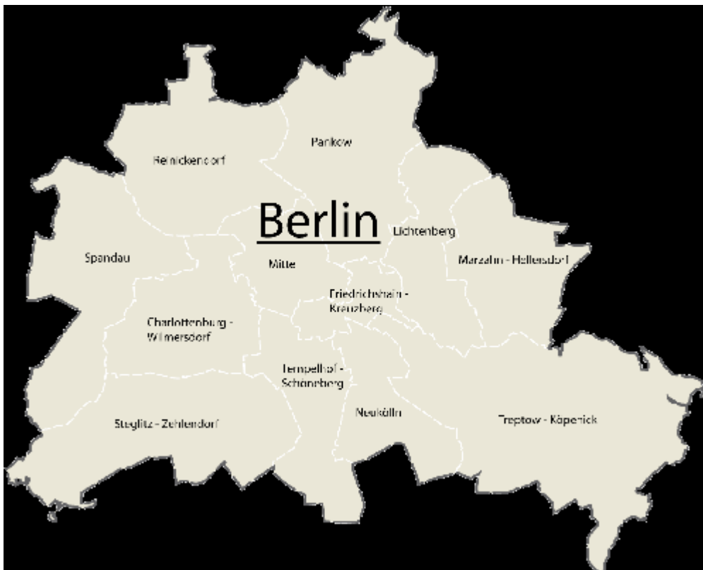
Slika 1: Berlin lega

V sledeči seminarski nalogi vam bom predstavila glavno mesto Nemčije Berlin. Za to mesto sem se odločila ker mi je že od nekdaj všeč in bi ga v prihodnosti tudi obiskala. Je drugo največje mesto v Evropski Uniji. Zvezna dežela Berlin v celoti leži znotraj zvezne dežele Brandenburg, je tudi priljubljeno turistično mesto saj slovi predvsem po mnogih dogajanjih v zgodovini. Povedala vam bom nekaj o mestu samem, o tamkajšnjih značilnostih, prebivalcih, podnebnju in še čim drugim, pri IKT pa smo se naučili tudi urejati besedila z Wordom, zato sem sledeče tudi naredila.