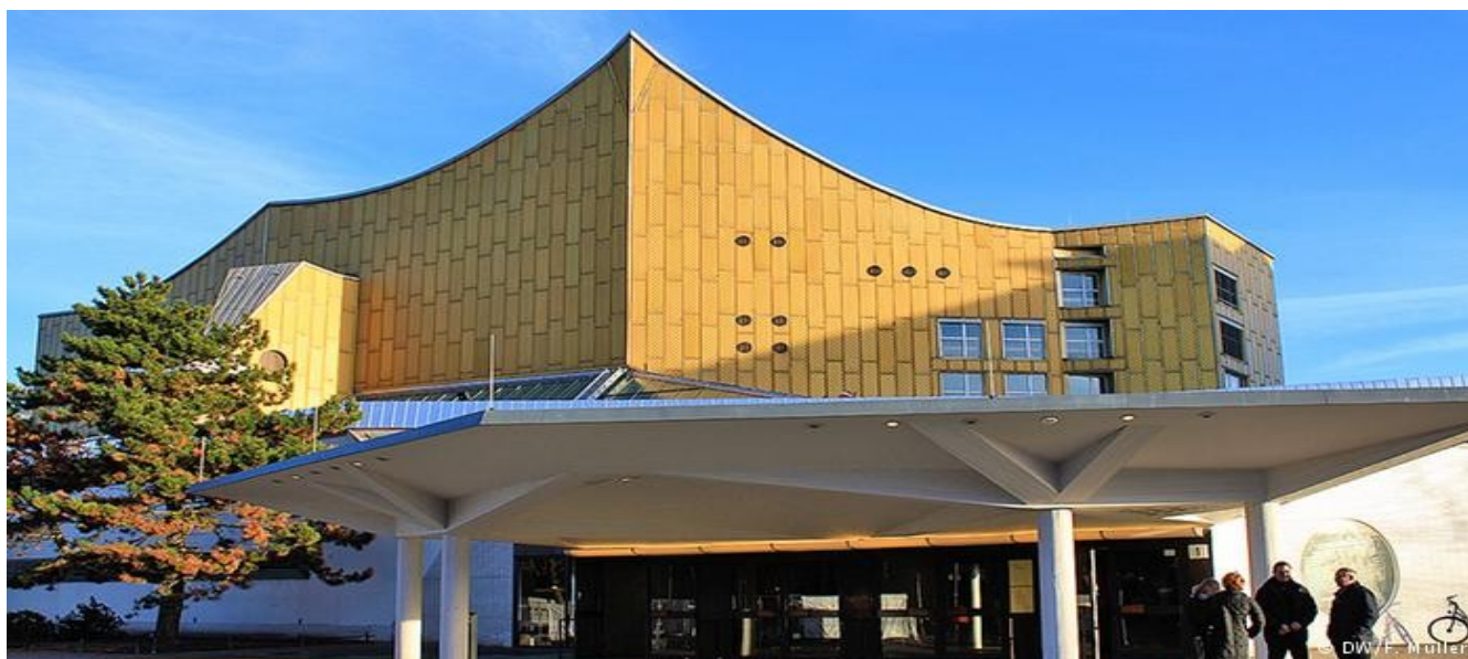
Slika 4: Berlinska filharmonija _

Berlinska filharmonija: V osrednji dvorani je 2440 sedežev, vsako leto se izvede približno 270 koncertov, nastopajo domači Berlinski filharmoniki in mnogi drugi. Načrt za novo Berlinsko filharmonijo je izdelal Hans Scharoun. Dela so potekala med letoma 1960 in 1963. Odprli so jo 15. oktobra 1963 s koncertom orkestra Berlinskih filharmonikov, ki ga je vodil Herbert von Karajan.