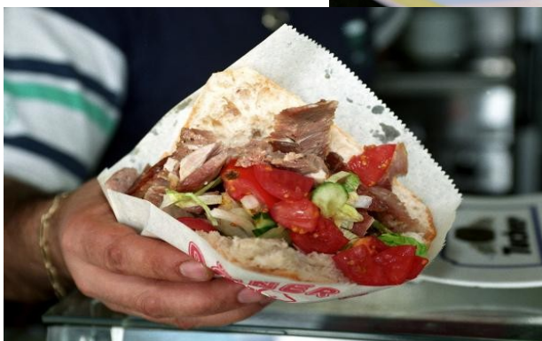
Slika 7- Döner-kebab

Döner-kebab z ovčjim ali piščančjim mesom ter zelenjavo.