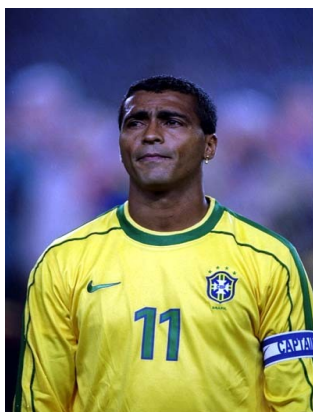
Romario de Souza Faria (Romario)