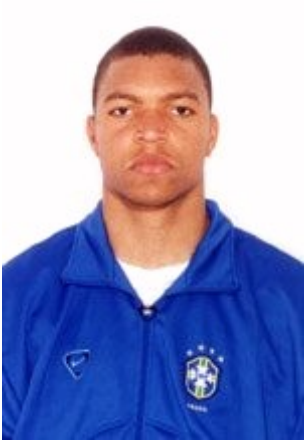
Nelson de Jesus Sliva (Dida)