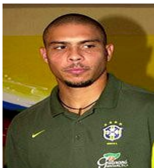
Luis Nazario de Lima (Ronaldo)