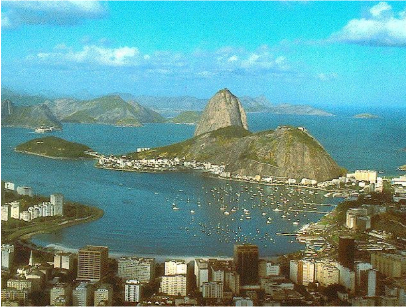
Pogled na Rio de Janeiro iz hriba Corcovado