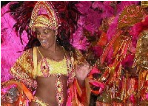
Prizor iz karnevala v Riu de Janeiru