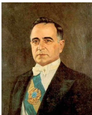
Getúlio Vargas – hud diktator in bivši predsednik Brazilije