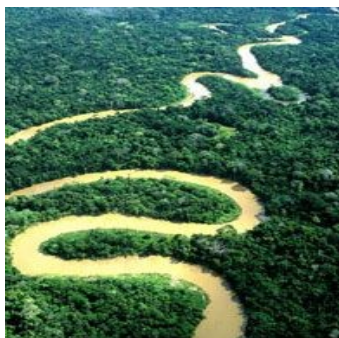
- reka AMAZONKA

Hidrografske se Brazilija deli na tri področja, od katerih porečje Amazonke obsega okoli 60% področja, porečje La Plata okoli 17% področja, ostanek pa pripada porečjem vzhodne Brazilije. V vzhodni Braziliji se je razvilo nekaj samostojnih rečnih sistemov. V področju Amazonke so nizka razvodja povzročila spajanje rečnih voda. Poznamo bifurkacijo reke Casiquiare, ki spaja porečji Amazonke in Orinoka. Brzice in slapovi ustvarjajo ovire za plovbo po velikih rekah.