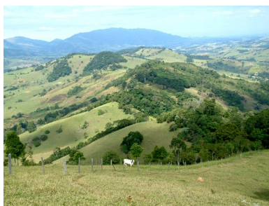
-Sera da Mantiqueira

Brazilijo geografsko sestavljajo tri naravne celote. Severni del države tvorijo obronki starega nizkega Gvajanskega višavja, nekaj južneje pa se širi velika nižina Amazonke, na jugu je Brazilsko višavje. Nižina Amazonke se razteza od podnožja Andov do Atlantskega oceana. Stara osnova je grajena iz starejših kristaliničnih in paleozojskih skrilavcev, pokrita pa je z mladimi in starimi nanosi Amazonke. Brazilsko višavje je z rečnimi dolinami razčlenjena enolična ravnina, ki se postopno znižuje od visokega roba ob Atlantski obali proti zahodu in severozahodu. Gorski greben Sera je grajen iz odpornih, pretežno eruptivnih kamenin (Sera Domar, Sera da Mantiqueira, Sera do Espinbaco). Najvišji vrh je Bandiera (2950 m). Strmi robovi primorskih Sera so močno erodirani. V severovzhodnem delu višavja so se razvile visoke ravnine Chapados, ki proti obali Atlantskega oceana prehajajo v nizke ravnine Sertao. Obala Brazilije je pretežno slabo razčlenjena. Prodišča zapirajo obalne lagune in jezera, najbolj sta poznani Lagoa Mirim in Lagoa dos Patos.