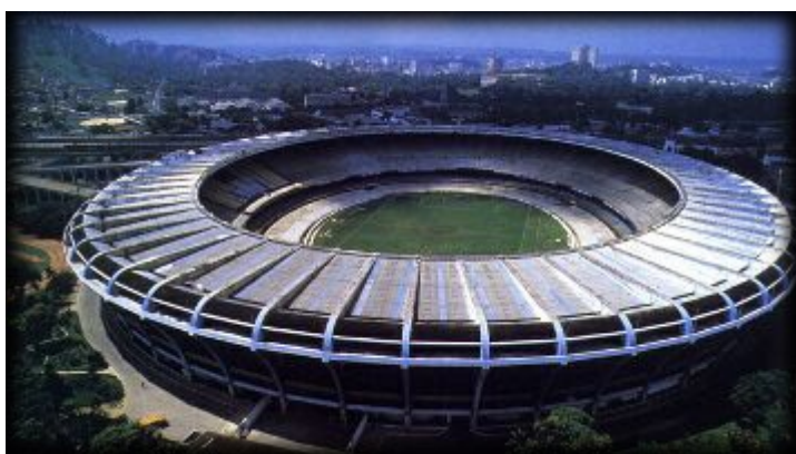
Stadion MARACANA v Riu de Janeiro