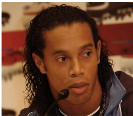
Ronaldo de Assis Moreira (Ronaldinho)