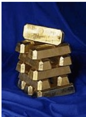
- Brazilsko zlato