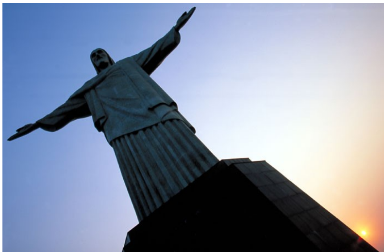
na hribu Corcovado