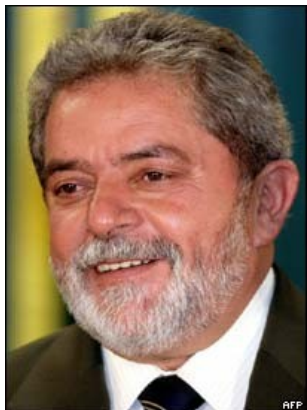
Luís Inácio Lula da Silva- predsednik Brazilije