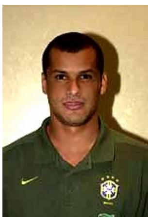
Vitor Borba Ferreira (Rivaldo)