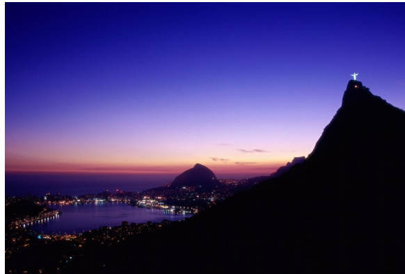
Slika 4: Kip Kristusa Odrešenikana hribu Corcovado