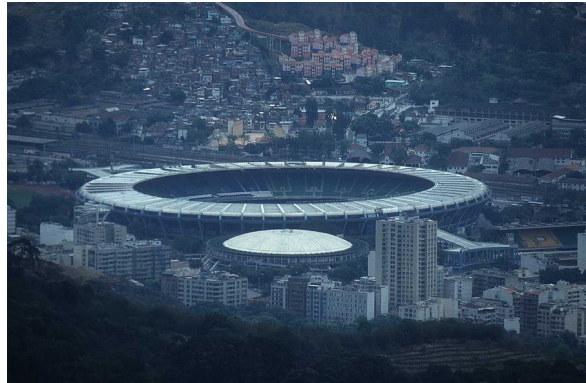
Slika 2: Največji stadion na svetu - Maracanã