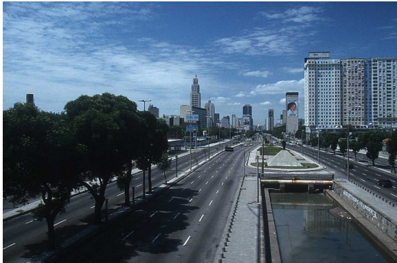
Slika 1: Rio De Janeiro