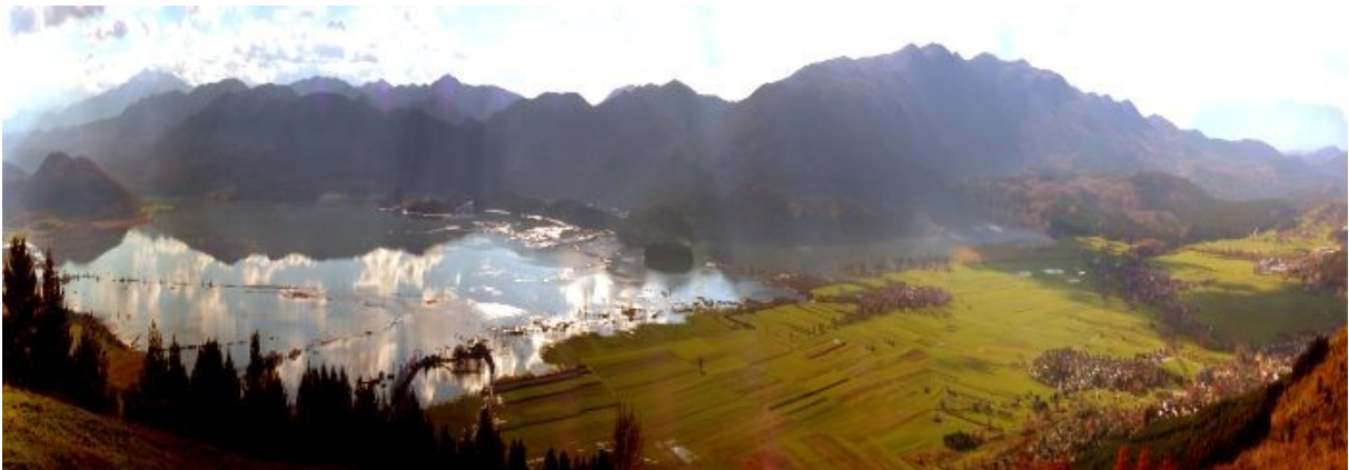
Slika 01: Cerknško jezero z letala

Ko sva izvedeli, o čem bova morali pisati, sva se razveselili, saj nama je bilo dodeljeno eno najbolj znanih, zanimivih in posebnih slovenskih jezer, Cerknško jezero. S skupnimi močmi sva se lotili raziskovanja. Prvi poskus nama ni najbolj uspel, v drugega sva vložili precej več truda. Upava, da je viden in da sva dobro in jedrnato predstavili značilnosti tega čudovitega slovenskega jezera.