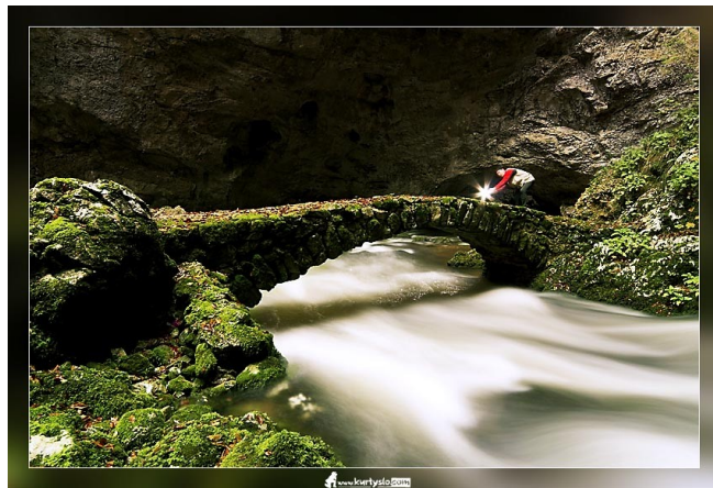
Slika 06: Rakov Škocjan

Slivnica je priljubljena planinska izletniška točka ljubiteljev narave in planinarjenja od blizu in daleč. Zaradi lahkega in hitrega dostopa, čudovite narave, svežega zraka, lepega razgleda in dobre družbe, je zelo obiskana predvsem ob vikendih v vseh letnih časih. Slivnica je še iz časov Valvasorja poznana kot zbirališče "coprnic" v Coprniški jami pod samim vrhom Slivnice. Čarovništvo domačini obujajo v vsakoletnem pustnem karnevalu, katerega se množično udeležijo tudi "današnje coprnice - čarovnice".