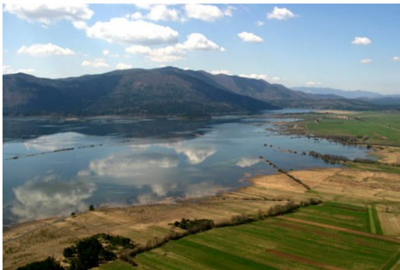
Slika 02: Cerknjško jezero

Jezero leži na kraškem polju , to je med apnenčastimi planotami od vseh strani zaprta uravnava, po kateri tečejo kraške vode: na zgornjem delu polja izvirajo, na spodnjem poniknejo. Dna kraških polj so pogosto poplavljeni. V jeseni se polje napolni, v poletnih dneh voda počasi odteka skozi požiralnike v notranjost. Takšno polje imenujemo presihajoče jezero .