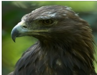
Slika 04: Planinski orel

Cerkniško jezero leži na eni od najpomembnejših selitvenih poti ptic selivk v tem delu Evrope, je eno od 9 ornitoloških lokalnitetov v Sloveniji, katero bi po evropskih kriterijih morali zaščititi. Tu srečamo preko celega leta okrog 200 vrst ptic in kar 85 jih gnezdi v jezeru ali ob njem. Med temi je tudi KOSEC , ki je svetovno ogrožena vrsta; na jezeru jih domuje še kakih 70 parov. V jezeru ima edino gnezdišče v Sloveniji RJAVOVRATI PONIREK , tu gnezdi tudi RDEČENOGI MARTINC , ki ima gnezdišče samo še na ljubljanskem barju. V jezeru se hranita tudi OREL BELOREPEC , in PLANINSKI OREL .