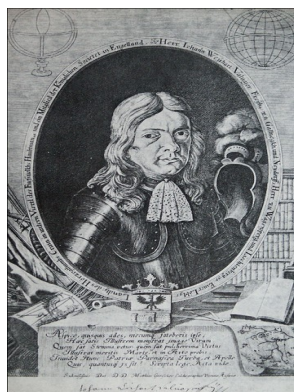
Slika 05: Janez Vajkard Valvasor