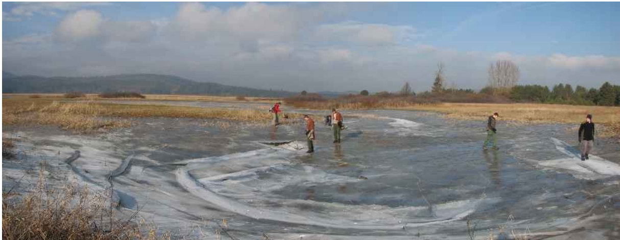
Slika 03: Cerkniško jezero pozimi