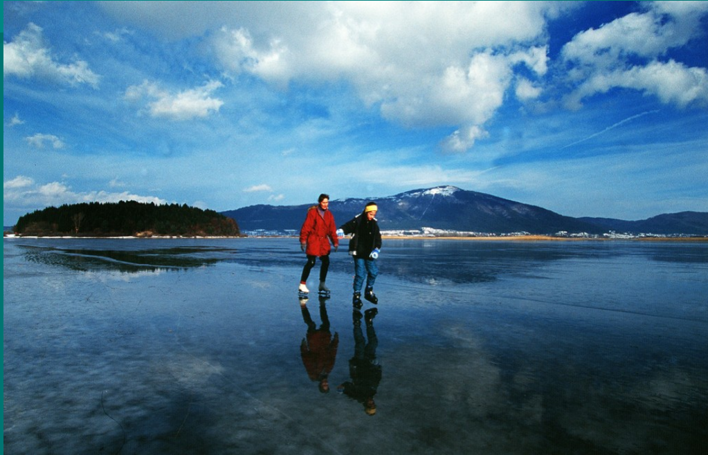
Drsalca na zamrznjenem ledu