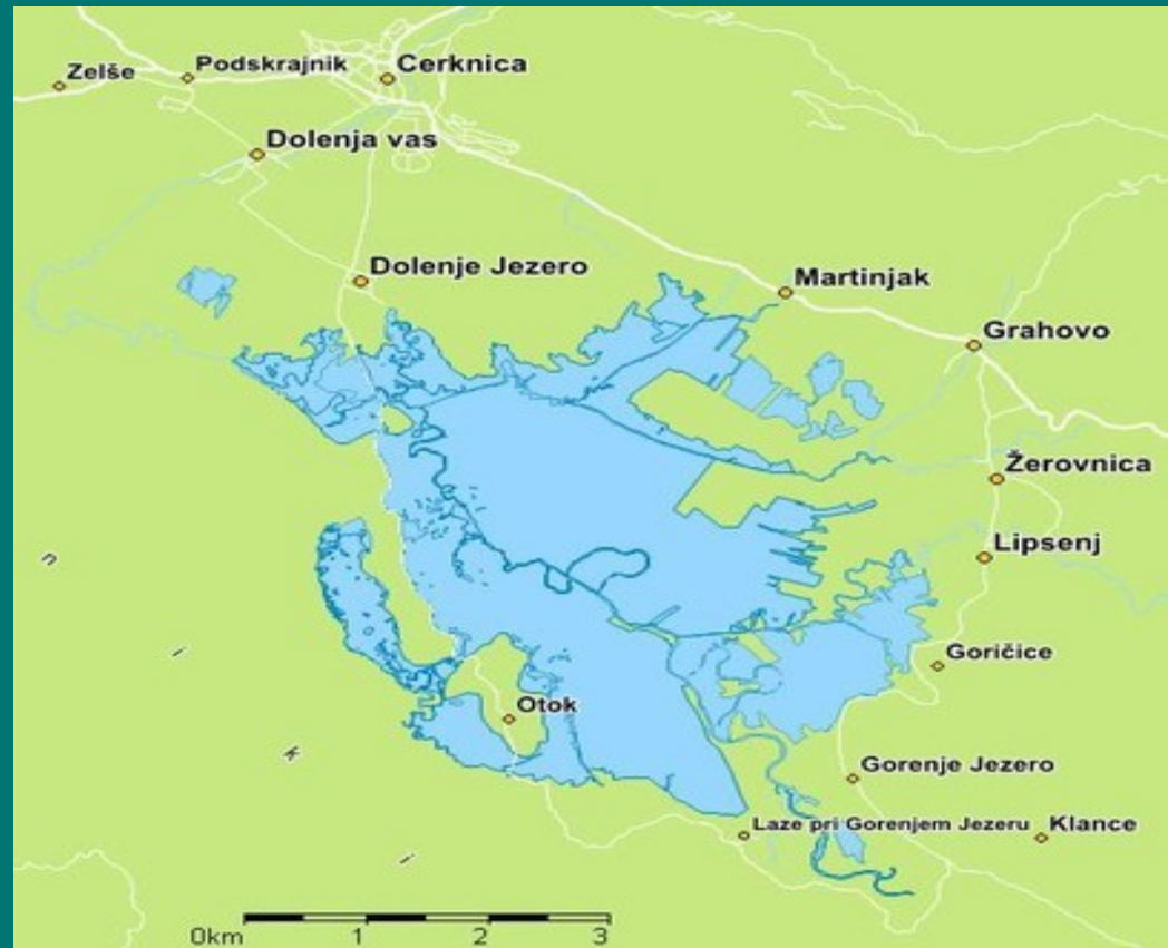
Obseg Cerknjškega jezera