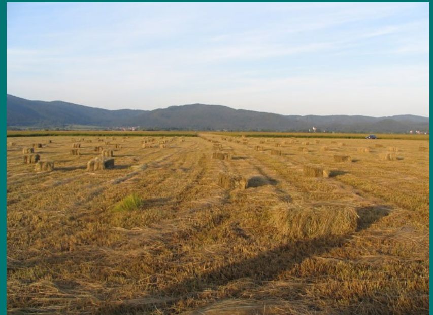
Kmetje suho travo pokosijo