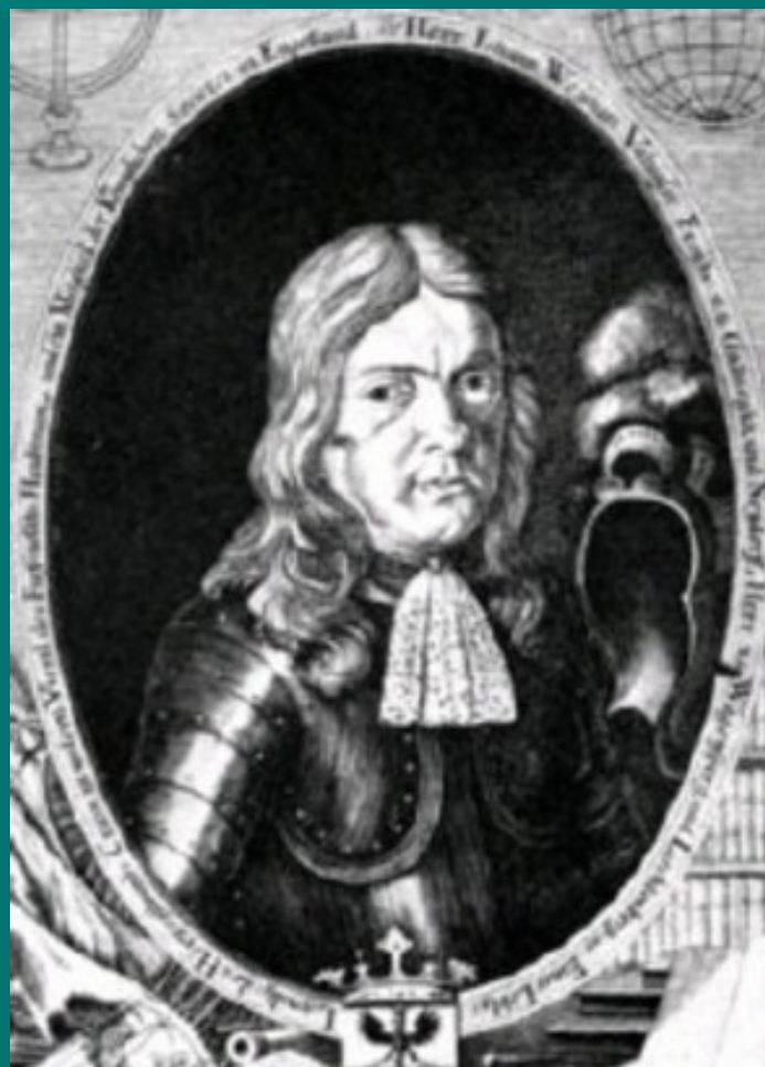
Janez Vajkard Valvasor