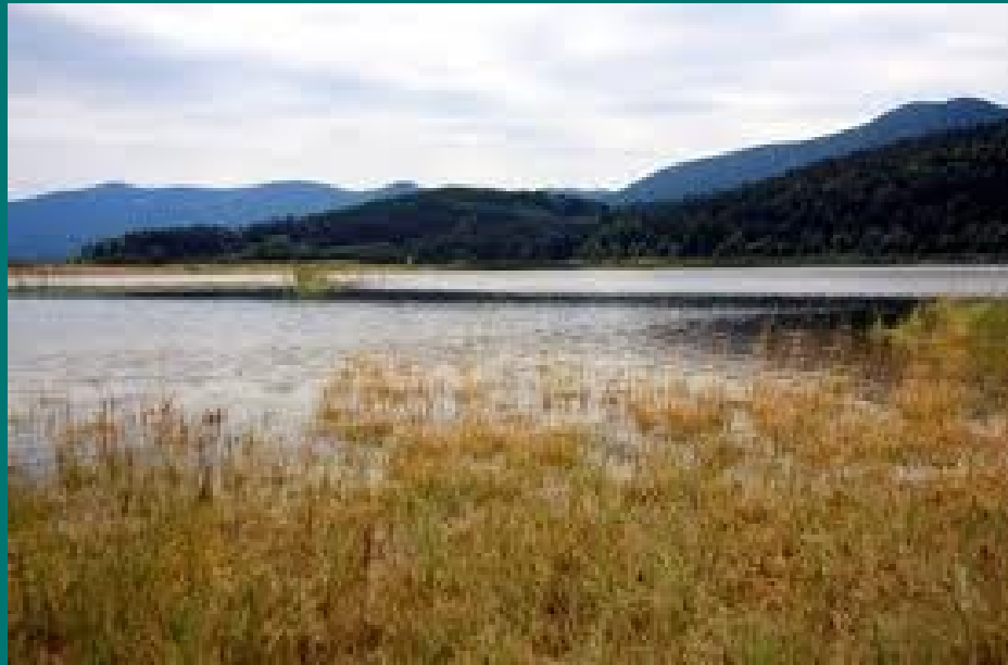
Med spreminjanjem v visoko travo