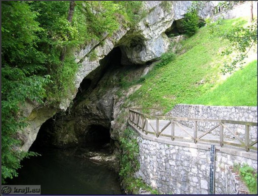
Reka Pivka (ponikalnica)

Značilne dinarske kraške planote so Trnovski gozd, Nanos, Snežnik, Bloke, Suha krajina. Kraški pojavi: vrtače, uvale, kraška polja, kraške jame in brezna. Značilna je rodovitna rdeča prst (jerovica).