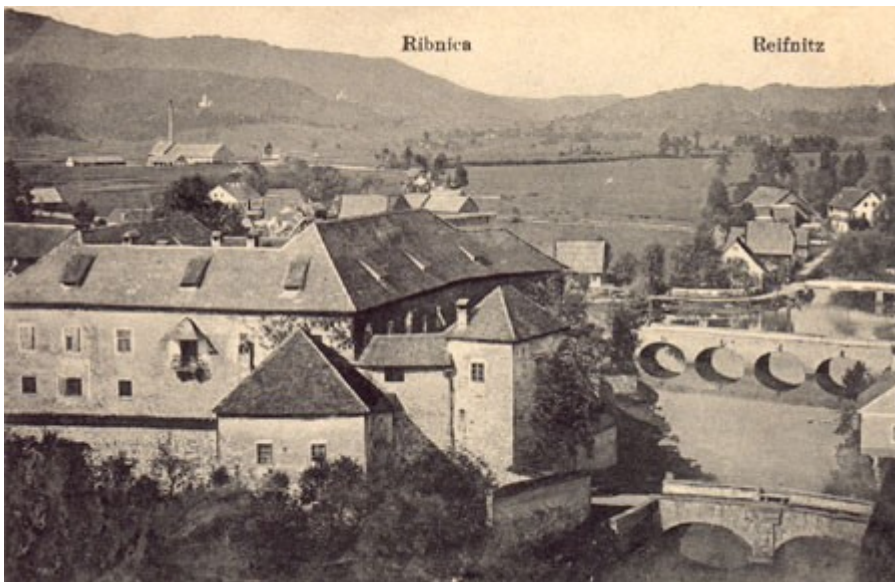
Stara slika gradu v Ribnici

Med zadnjo svetovno vojno v dobršni meri požgani in pozneje porušeni grad ob rečici Bistrici je sodil v skupino zgodnjih, večidel v drugi polovici 12. stoletja pozidanih gradov kastelnega tipa, obsegajočih eno- ali dvonadstropni palacij ter z obzidjem zavarovano notranje dvorišče s cisterno. Še v srednjem veku so to zasnovano znotraj oboda dopolnjevali, konec 15. in v 16. stoletju pa so jo obdali z novim vencem obzidja s stolpi, ki so prevzeli težo obrambe ob morebitnem sovražnikovem napadu. Del tega obzidja z arkadami in dvema stolpoma je danes edini preostanek nekdanjega mogočnega, z vodnim jarkom obdane stavbe, ki se je v zadnjih stoletjih čedalje bolj spreminjala v udobno plemiško prebivališče. Kljub temu da je bil večidel porušen, ohranja Ribniški grad vlogo kulturnega središča, kakršno je imel nekdanje. Pod okriljem Javnega zavoda Miklova hiša je tako danes v gradu manjši muzej z etnografsko zbirko - česa drugega kot slavne ribniške suhe robe in lončarskih izdelkov - ter arheološko zbirko s prikazom najdb iz bronaste dobe. Nekdanjih grajskih slavij se zidovi spominjajo ob poslušanju poročne koračnice, ki ob sobotah doni iz poročne dvorane. Znotraj nekdanjega obzidja so med ostanki temeljev urejeni še Park kulturnikov s poprsji slavnih mož, manjša forma viva ter poletno gledališče, v katerem je vsako leto poletni festival amaterskih gledališč, vsako prvo nedeljo v septembru pa prireditve ob ribniškem sejmu.