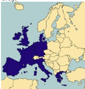
1986 Španija in Portugalska