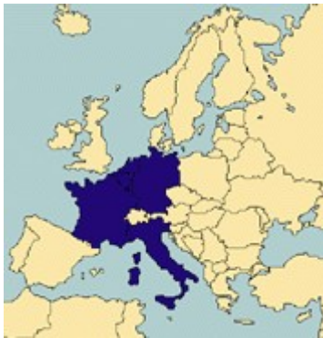
1952 Belgija, Francija, Nemčija, Italija, Luksemburg in Nizozemska