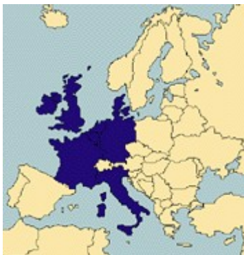
1973 Danska, Irska, Velika Britanija