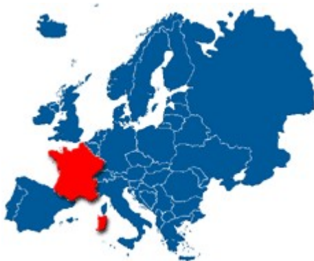
Lega Francije v Evropi

Obsega 547,030 km 2 površine. Ta se deli na zemljo- 545,630 km 2 in vodovje- 1,400 km 2 .