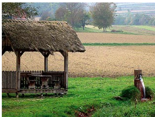
Slika 2: Slatinski vrelec