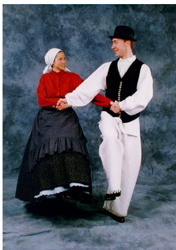
Slika 5: Narodna noša z Goričkega