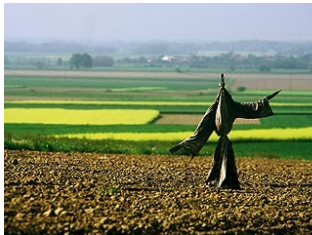
Slika 4: Prst in obdelovalne površine

V razgibanem reliefu prispevajo k denudaciji in eroziji prsti neugodne površinske in podnebne razmere. V zimskih mesecih s skromno snežno odejo površje zmrzne, zato ob spomladanskem taljenju nastanejo ugodne razmere za polzenje prepereline. Ker je erozija velik problem, se kmetje pred njo borijo tako, da čez njive na nagnjenih pobočjih skopljejo jarke. Na ta način omilijo ploskovno odnašanje prsti. Površine, kjer je bil boj z erozijo zemljišč neuspešen, pa so pogozdili in s tem površine ekonomsko uporabili in preprečili odnašanje.