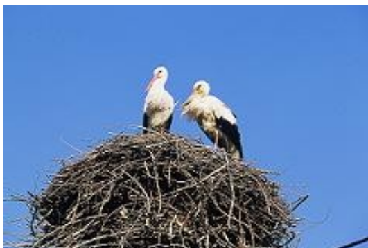
Slika 1: Štorke v gnezd

Goričko s svojimi 492 km obsega več kot polovico slovenskega ozemlja severno od Mure med Avstrijo na zahodu in Madžarsko na severu in vzhodu. Ta gričevnat svet je zgrajen iz terciarnih in pleistocenskih usedlin (glina, pesek, prod) se s stopničastimi prehodi vzpenja do državne meje, kjer se vzpne malo čez 400 m. Taki vrhovi so naprimer: Sotinski breg (418 m; najvišji vrh na Goričkem ), Rdeči oz. Serdiški breg (416 m), Križarka (413 m) in Srebrni breg (404 m). Prodnato peščeno gričevje poraščajo predvsem borovi gozdovi, večji nasadi vinogradnikov so na južnih obronkih okrog naselij Vaneča in Mačkovci ter med Moravskimi Toplicami in Dobrovnikom. Prebivalci osrednjega in vzhodnega Goričkega so v glavnem evangeličani, v Ledavskem dolu pa prevladujejo katoličani. Evangeličansko območje je precej redkeje poseljeno od katoličanskih predelov. Dosti ljudi se ukvarja s poljedelstvom in živinorejo, dosti pa jih tudi dela v bližnji Avstriji. Zadnje čase so v velikem razponu Turistične kmetije in vinotoči. Značilnost Goričkega so tudi štorke (po prekmursko štrki), ki so značilne ptice na tem območju. Na hišah, drevesih in električnih drogovi se nahaja okrog 100 njihovih gnezd.