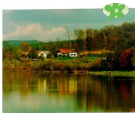
Slika 3: Ledavsko jezero

Po površku Goričkega tečeta Ledava in Krka s pritoki. Potoki, ki se izlivajo v Ledavo, tečejo večinoma od severa proti jugu, tisti, ki pa se izlivajo v Krko pa od zahoda proti vzhodu. Pri prehodu na ravnino, kjer se jim strmec zmanjša, odlagajo gradivo in oblikujejo veliko manjših vršajev. Dolina Ledave na zahodnem Goričkem je po geološki zgradbi starejše in po kamninski sestavi bolj pestro od vzhodnega dela. Ledava je ustvarila tudi širšo dolino in s tem več možnosti za poselitev za razliko od srednjega Goričkega, kjer so doline razmeroma ozke in neprimerne za poselitev. Na severovzhodu pa se je v porečju Velike Krke izoblikovala nekoliko širša dolina, ki se proti vzhodu odpira na madžarsko stran. Skoraj celotno Goričko spada v porečje reke Mure in sicer največji delež voda z Goričkega odteče po treh pritokih Mure; Ledavi, Krki in Kucnici. Ledava ima visoko vodo ob spomladanskem deževju, ki ga spremlja taljenje snega, nizko pa poleti in pozimi. Da bi ublažili visoke vode ob močnejših nalivih in neurjih, so zajezili Ledavo nad Domajinci (Ledavsko jezero).