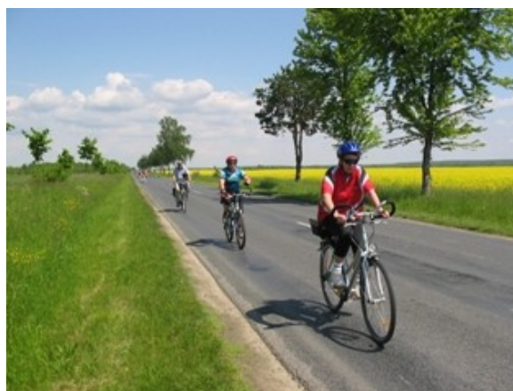
Slika 7: Kolesarjenje je na Goričkem zelo priljubljeno

Na Goričkem je veliko možnosti za turizem. Narava je neokrnjena, povsod veliko živali, dreves in svežega zraka. Turisti pridejo na Goričko nabirat predvsem gobe in kostanje, ali pa na sprehode po naravi - ob številnih potokih, njivah in vaških cestah. Številne so tudituristične kmetije, ki ponujajo Goričke dobrote. Številni so tudi vinotoči, ki ponujajo domača vina, narezke in podobno.